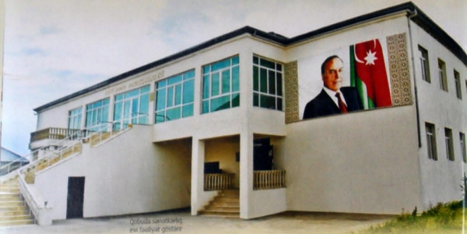
Qobuda sənətkarlıq evi fəaliyyət göstərir

Q obu - Ağsəran rayonunun inzibati ərazi vahidlərindən biridir. Adına "qəsəbə" - də deyirlər. Lakin, bir qayda olaraq, Qobu da kənd kimi qəbul olunur. Qobunun təbii, təsərrüfat sahələri, əhəli, məişət üslubu, mətbəxi... bir sözlə, hər şeyi əsl kənd həyatını əks etdirir.