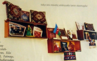
Xalça sənəti müasir ədəbiyyatla təmin oluna bilər

şil rəngli vəl və ensiz zolaqların bəzədiləyi palazlar istəki koloriti, yununun zərif emalı və toxunuşu ilə seçilir".