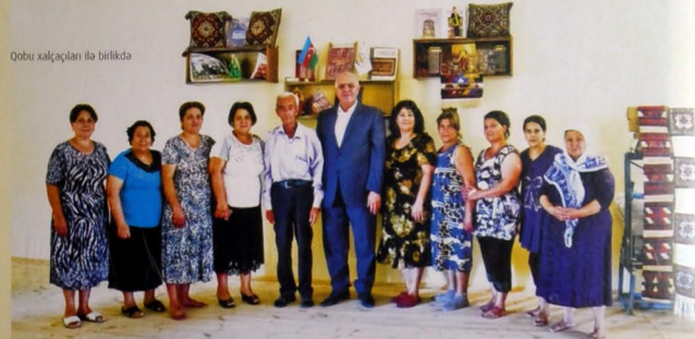
Qobu xalçaçıları ilə birlikdə

Kəndin özünəməxsusluğunun qorunmasında xalçaçılığın rolu əvəzsizdir. Hətta sovet dövründə belə Qobu xalçaçılığının inkişafını dayandırmıq, onu məhv etmək mümkün olmayıb. Ümumiyyətlə, həmin dövrdə Azərbaycanda, həmçinin ayrı-ayrı Bakı kəndlərində fəaliyyət göstərən xalça sexləri arasında 1971-ci ildə "Azərbaycan"nın nazdında yaradılmış Qobu İncəsənət-xalça sexi işçilərinin sayına, məhsullarının keyfiyyətinə görə seçildi. Lakin burada da problemlər bir məqam var. Bu problema aydınlıq gətirmək üçün bir qədər ətrafı şərhə ehtiyac yaranır.