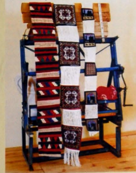
Səda süvənli xalçaların toxunu.

Burada toxunan "Çiyi palaz" yulniz Bakı toxucuları arasında peşqarlıqla icra edilmişdir. Bu palazlar üçün ala-bəzək zolaqlar üzərində toxunan smiq xatlı, romblar və s. elementlər xarakterikdir. Üfünqi istiqamətdə toxunan məvi, sürməli, qırmızı, sarı, ya-