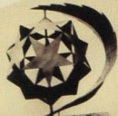
Xudu müəllimin ədəbiyyatı əsərində hazırlanmışdır

mış, öz laboratoriyasından olan gənc alimlərlə birlikdə sənətin di prinsipi üzərində çalışmışdır. Düşüncələrinin praktiki şəkildə ornament kompozisiyaları üzərində reallaşdırmışdır. O, ən böyük hikmətin xalqın öz dilində, öz yaratdığı sənətdə olduğunu yaxşı bilirdi. Dəvənin və tələbin dikmə etdiyi qəliblər onun dünyagörüşünü, arzularını və əməllərini buxovlaya bilməmişdi. O, bu məmləkətin dadım-düzümü elmi dəşmişdir. Milli mədəniyyətimizin köklərini başqa yerlərdə deyil, elə təbii təvəzin, özümüzə, tariximizdə, adət-ənənələrimizdə, məişətimizdə axtarmağa çalışmışdır. Türkün yaşadığı coğrafi ərazilər, iqlim, daşın, torpağın onun sənətinə, ələ əməyinə necə hödəğünü nümayiş etdirmişdir. Va bu heç də sovet dönməsinə comiyyətini "susadığı" populyar çuxşlardan deyildi. Onun elmi fikirləri naimki Azərbaycanda, onun sərhədlərindən çox-çox kanarlarda qəbul və təsdiq olunmuşdu. Sistem, struktur, sim-