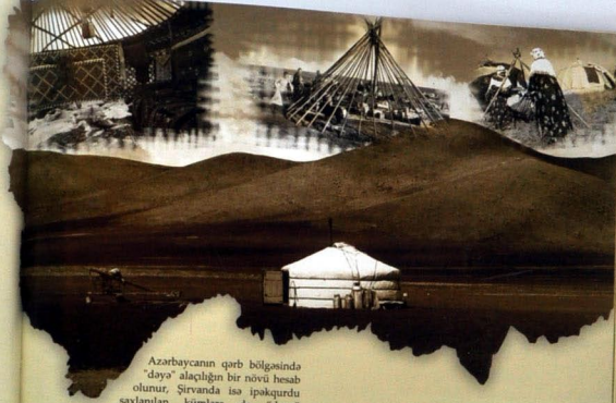
Azərbaycanın qərb bölgəsində "daya" alaçqının bir növü hesab olunur, Sırvanda isə ipəqürdü saxlanılan kümlərə də "daya" deyirlər. Ümumiyyətlə, daya bir çox türkdillil xalqlar arasında yayılaraq yaşayış evi monasidən işlədilan bir termindir (8, 132).

Müvəqqəti yaşayış evlərinin bir tipi də alaçqı idi. Dayoya nisbətən mürəkkəb konstruksiyaya malik olan alaçqı ham da həcmindən böyüklüyünə görə fərqlənirdi (17, 65). Dayadən fərqli olaraq, "qaraqəçə" adlanan alaçqlar bir qədər iri həcmə və uzunsov formada qurulurdu (7, 67). Onu tikmək üçün gəzəyan müəyyən edilmiş yerə ağac müxə çalıb, ucuna ip bağlayırdılar. İpi mıxanın dövrəsi boyunca 6-8 addımlıqda fırladaraq, yerə dairə çökür və bir qayda ilə alaçqın dövrəsinə müəyyən edirdilər. Bundan sonra dairənin xaricinə təxminən 3-5 m hündürüylümdə "sunacaq" basdırırdılar. Azərbaycanın ayrı-ayrı bölgələrində sunacaq (sunacaq) "çöyü", "köskü", "çatma-qıvıx", "dirəncək", "lobar" adları ilə məlum idi. Alaçqlarda sunacaqın qoyulması həm onun həcminin genişlənməsinə, həm də qolubun ağırlığı altında çubuqların möhkəm dayanmasına təminat verirdi. Bəzi zəngin ailələrin alaçqlarında sunacaq "şirəzi", "çuxur" olurdu. Belə sunacaqların üzəri oyma üsulu ilə millil ornamənt və nağıllarla bəzədilir, ətrafında çoxlu tibet biçimlən olurdu ki, oraya paltar, silah, xəncər, ov avadanlığı və s. asırdı. Sunacaqın başına çəmborəsi (sağanəği) boyunca 30-a