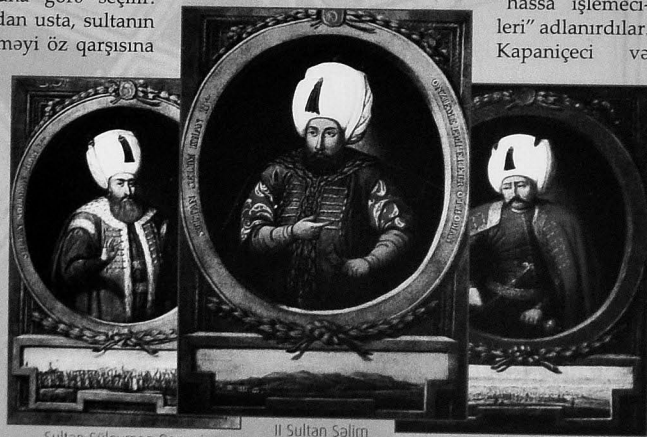
Sultan Süleyman Qanuni