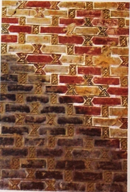
Olcaytu Xudabəndə türbəsinin divar təşəkilində naxışlı təsvirlər.