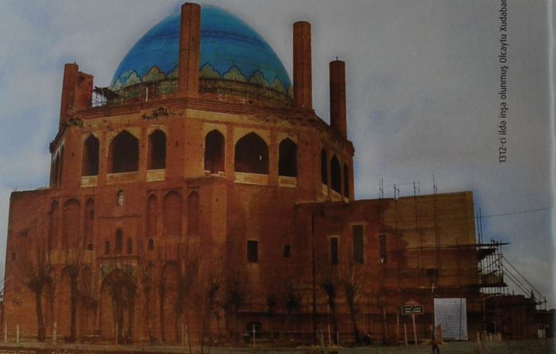
1312-ci ildə inşa olunmuş Olcaytu Xudabəndə türbəsi İmamzadəsi. Sultaniyyə şəhəri, İran

Açar sözlər: dini tikililər, memorial tikililər, Olcaytu Xudabəndə türbəsi