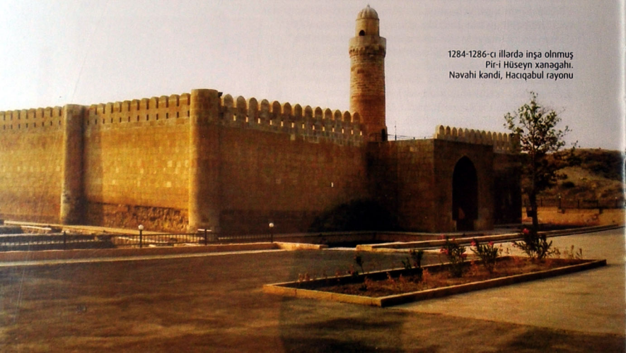
1284-1286-cı illərdə inşa olunmuş Pir-i Hüseyin xanəqahı. Navahi kəndi, Hacıqabul rayonu

Elxani xanların xüsusi istəyi və köməkliyi ilə bu ölkənin bütün ərazisində olduğu kimi, Azərbaycanda da mədəniyyətin əsas göstəricilərindən biri olan memarlıq yüksək səviyyədə inkişaf etmişdir. Bu inkişafın digər əsas səbəblərindən biri də yerli ənənələrin mövcud olması idi. İslam dininin dövlət səviyyəsinə yüksəldilməsi isə bu inkişafa təkan vermiş oldu. İngilisdillə tarixşünaslıqda isə kompleks şəkildə olmasa da, mövcud problema dair yetərli sayda məlumatlar mövcuddur.