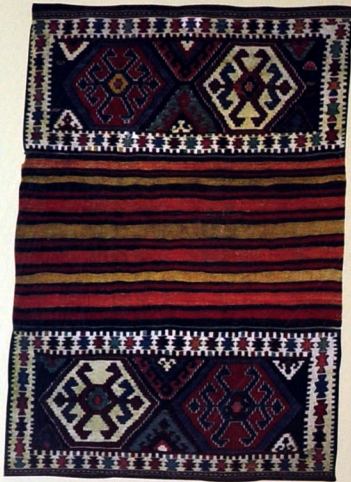
Mafraq (fragment). Yun. Xovsuz. 159x108. XIX əsrin sonları. Qarabağlır kəndi, Kəngərli rayonu, Naxçıvan MR.

paq, Xartlıq, Qızılzaraba, Kom, Raşoğlu və Almalıq kəndlərində Kolani tayfasının əksəriyyət və ya nəzərə çarpacaq qədər çox sayda olmasından məlumdur (7, s.62). 1590-cı ilə aid sənəddə Vədi nahiyəsində Cərmaris, Ciqin, Bağçacıq və Qızılvaran kimi kəndlər qeyd olunmuşdur. Cərmaris kəndi sonrakı dövrlərdə "Cərmaris Kolani" və son olaraq "Kolani" adlanmış, Qızılverən (Qızılvaran) və Bağçacıq kəndləri də bu tayfanın yaşadığı kəndlərdən olmuşdur. Sonrakı mənbələr əsasında öyrənilir ki, bu tayfa nahiyədə qeyd olunan Ciqin kəndinin adı ilə bağlı olan Ciqin dərəsində də yaşamışdır. Sonrakı dövrlərdə Vedibasarda yerləşən Kolani kəndləri Dərələyəz mahalı ilə Vedibasara mahalının qonşuluğunda yerləşirdi. Dərələyəz mahalında eyniadlı kənd XVIII əsrin birinci yarısından etibarən eyniadlı tayfaya məxsus yaşayış yeri olmuşdur. Bu tarixdən əhalinin köçü baş vermiş, kənddə iki qeyri-müsləman sakinin məskunlaşdığı bildirilmişdir. Ehtimal ki, tayfanın Naxçıvan bölgəsindən və ya Qarabağdan Şirvan ərazisinə ilk köçləri də bu dövrlərdə baş vermişdir.