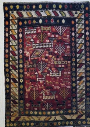
Xalça. Yun. Xovlu. 137x104. XX əsrin ortaları. Qaraçala kəndi, Salyan rayonu.

1840-1849-cu illərdə Şirvanda kolanların yaşadıqları ərazilərə rus koloniyaları yerləşdirilmişdir. 1840-cı ildə əhalisi ruslardan ibarət olan Xilmilli, 1849-cu ildə isə Astraxanka (Qızmeşdən) kəndləri yaradılmışdır. Beləliklə, Kolanı elatı öz ərazilərindən çıxarılış və həmin illərdə Şamaxı şəhərinin yaxınlığında, indiki Sabir qəsəbəsinin şimal-şərqində yerləşdirilmişdilər. Bu ərazi heyvandarlıq üçün əlverişsiz olduğundan tayfa dağlıq bölgəyə - Girdə yaylasına köçmək məcburiyyətində qalmışdır. Sayca get-gedə daha da çoxalan tayfa heyvandarlıqla məşğul olurdu. Əhali Kür çayı sahillərində qışlayır və zaman keçdikcə bu ərazilərdə məskunlaşaraq bir sıra yaşayış məntəqələrinin əsasını qoyur. Şamaxı bölgəsinin kolanları XVIII əsrdə müasir Şabran və Quba rayonunun ərazisinə (16, s.18), XIX əsrin ortalarında indiki Siyəzən rayonunun Kolanı kəndinə, XIX əsrin sonlarında indiki Neftçala rayonunun Uzunbabalı kəndinə, 1914-1915-ci illərdə indiki Sabirabad rayonunun Kolanı kəndinə yerləşirlər. Hacıqabul rayonunda əsasən tayfanın Türəni qolundan olanlar məskunlaşmışdılar. Sonradan Girdə yaylasında