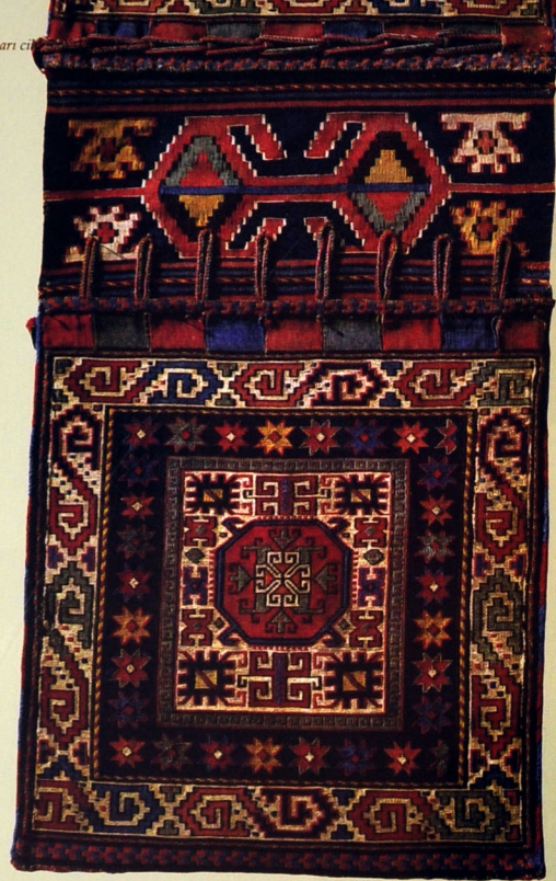
Xurcun, Yun. Xovsuz 128457. XX əsrin əvvəlləri. Keçimbiyül kəndi, Salyan rayonu, Azərbaycan.