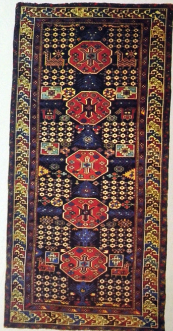
Xalça. Yun. Xovlu. 222x126. XX əsrin avvalları. Poladlı kəndi, Qobustan rayonu.