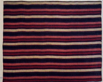
Cecim. Yun. Xovsuz. 136x122. XX əsrin əvvəlləri. Badamlı kəndi, Şahbuz rayonu, Naxçıvan MR.