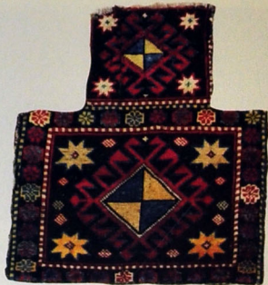
Duz qabı. Yun. Xovlu. 48x41. XIX əsrin sonları. Xilmiilli kəndi, Qobustan rayonu.