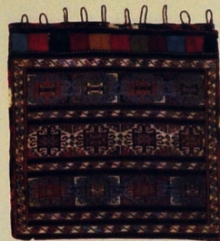
Xurcun (fragment). Yun. Xovsuz. 61x57. XIX əsrin sonları. Uzunbabalı kəndi, Neftçala rayonu.

əvvəl digər tayfalar da olmuşdur. Lakin yaylaq ərazisində mövcud olmuş Dağ Kolanı kəndinin qəbristanlığının tarixi, yerli sakinlərin fikrincə, XV əsərə aiddir. Onların Naxçıvandan və Qarabağdan Şirvan ərazisinə daha əvvəl köçməsi səbəbləri və faktlar barədə yuxarıda məlumatlar verilmişdir. Osmanlı hücumları, Şah Təhməsinin "yandırılmış torpaq" taktikası ilə köçürmə siyasəti bu tarixi yarım əsr geriyə apa-