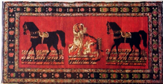
Xalça. Yun. Xovlu. 320x141. XX əsrin əvvəlləri. Kolanı kəndi, Şahbuz rayonu, Naxçıvan MR.

Şahbuz rayonunun Kolanı kəndi yaxınlığında, Aşağı Qışlaq kəndi ilə Biçənək kəndi arasında olan "Mirzə vurulan yer" adlı qayaqlar onun adı ilə bağlı ola bilər.