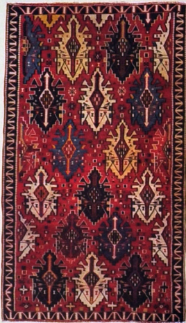
Kilim. Yun. Xovsuz. 335x172. XX əsrin əvvəlləri. Düzənlik kəndi, Qobustan rayonu.