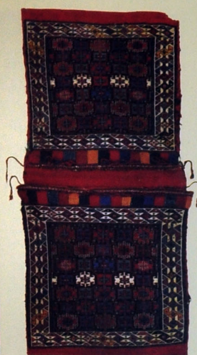
Xurcun. Yun. Xovsuz. 134x62. XX əsrin avvalları. Kolanı kəndi, Şirvan rayonu.

Kolanı tayfası Qərbi Azərbaycan torpaqlarının qədim sakinlərindən olmuşdur. Göyç gölü sahilində XVIII əsrdə böyük Kolanı tayfalarının olması haqqında mənbələrdə məlumatlara rast gəlinir. Təəssüf ki, bölgədə bu tayfanın tarixi daha çox sürgünlərlə və qırğınlarla yadda qalır. Tayfanın Qərbi Azərbaycan torpaqlarında daha sıx məskunlaşdığı bölgələrdən biri Göyç gölü sahilləri olmuşdur. 1728-ci ilə aid mənbələrdə bu ərazidə kolanıların yaşaması barədə məlumatlara rast gəlinir. Həmin dövrdə Göyçə nahiyəsində Kolanı kəndi haqqında bəhs olunur. Bu kəndin ödədiyi verginin miqdarına əsasən, Göyçə nahiyəsinin 7-ci böyük kəndi olduğu, nahiyəyə tabe olan digər 37 kənddən böyük olduğu məlum olur. Artıq qeyd etdiyimiz kimi, Göyçə gölündən Tortərədək olan ərazi tarixi Kolanı məskənləri idi. Eyni zamanda XVI əsrdə Dərələyəz və Vədi mahallarında olan Kolanı kəndləri barədə Naxçıvanda yaşayan kolanıların bölməsində məlumat verilmişdir.