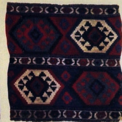
Mafraş (fragment). Yun. Xovsuz. 115x100. XX əsrin əvvəlləri. Poladlı kəndi, Qobustan rayonu.