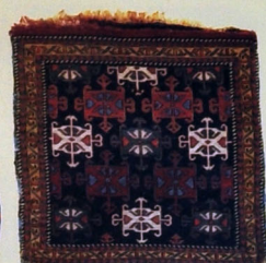
Xurcun (fragment). Yun. Xovsuz. 59x53. XX əsrin ortaları. Kolanı kəndi, Salyan rayonu.

rır. Bu tayfanın Şirvana məhz XVI əsrdə Qarabağdan və Naxçıvandan gəlməsi onların Şirvanda ilk məskunlaşma tarixi kimi qəbul oluna bilməz. Məlum olduğu kimi, Şirvan ərazisində türk tayfalarının məskunlaşma tarixi qədim dövrlərə təsadüf edir. Kolanı tayfasının bəzən "Kolan" olaraq da adlanmasına Şirvanda da rast gəlinir. N.Bəndəliyev kolanların Goran, Qaraoğlanlı, Pirəvənd, Osallı, Türəni, Şadlı, Həzili, Ağsaqlı, Lolaylı və Alataxtalı kimi qollarının XVIII əsrdə Şirvanda məskunlaşdıqları haqqında məlumat verir. XVIII əsrdə Quba xanlığının Şabran mahalında 60 həyətdən ibarət Kolanı və 130 həyətdən ibarət Osallı kəndləri olmuşdur. Bu kəndlərin yaranma tarixinin araşdırılmasına ehtiyac vardır. Qubalı Fətəli xanın Qarabağa hücumları zamanı çoxlu sayda əhalini köçürüb aparması faktı da bu məsələyə aydınlıq gətirə bilər. Eyni zamanda, mənbələrdə 1796-cı il köçürməsi zamanı da bu əraziyə Kolanı tayfalarının köçməsi haqqında məlumatlar vardır. I rus-İran müharibəsi zamanı Şirvanın bəzi tayfaları Pirqulu xan Qacarlı tərəfindən Muğan-Talış bölgəsinə köçürülür. Şirvanlı Mustafa xan apardığı danışıqlardan sonra bu tayfalardan geri qayıtmaqlar olmuşdur. Köçürülən tayfalar içərisində kolanların da olduğu ehtimalı vardır. Biləsuvar rayonu ərazisində kolanların məskunlaşdırılması, İrəvan Muğan bölgəsindəki Kolan kəndi bu köçürmənin nəticələrindən ola bilər.