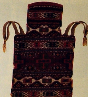
Duz qabı. Yun. Xovsuz. 71x49. XIX əsrin sonları. Qizmeydan kəndi, Şamaxı rayonu.