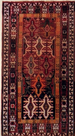
Kilim. Yun. Xovsuz. 364x186. XX əsrin əvvəlləri. Poladlı kəndi, Qobustan rayonu.

əvvəl digər tayfalar da olmuşdur. Lakin yaylaq ərazisində mövcud olmuş Dağ Kolanı kəndinin qəbristanlığının tarixi, yerli sakinlərin fikrincə, XV əsərə aiddir. Onların Naxçıvandan və Qarabağdan Şirvan ərazisinə daha əvvəl köçməsi səbəbləri və faktlar barədə yuxarıda məlumatlar verilmişdir. Osmanlı hücumları, Şah Təhməsinin "yandırılmış torpaq" taktikası ilə köçürmə siyasəti bu tarixi yarım əsr geriyə apa-