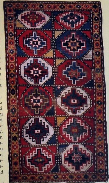
Xalça. Yun. Xovlu. 194x116. XIX əsrin sonları. Xinzirək kəndi, Şahbuz rayonu, Naxçıvan MR.

Sovet hakimiyyəti illərində elektrifikasiya və avtomobil yollarının salınması adı altında Naxçıvanın bir sıra kiçik kəndləri ləğv edilmişdir. Şahbuz rayonunun kolanı tayfasına da yaşadıqı Qaraboya kəndi də ləğv edilmiş və onun əhalisi əsasən həmin rayonun Badamlı kəndinə yerləşdirilmişdir. Bir qədər əvvəl kolanı tayfasına da yaşadıqı digər bir kiçik kənd olan Xinzirək kəndi də ləğv olunmuş və əhalisi əsasən qonşu Biçənək kəndinə yerləşdirilmişdi. Güman etmək olar ki, sovet hökuməti tərəfindən Xinzirək və Qaraboya kəndlərinin də ləğv edilməsi azərbaycanlılar əleyhinə yönəldilmişdir.