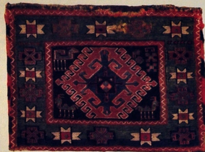
Xurcun (fragment). Yun. Xovsuz. 66x48. XX əsrin əvvəlləri. Xunut kəndi, Vedi mahalı, Qərbi Azərbaycan.

Xalça. Yun. Xovlu. 198x115. XX əsrin əvvəlləri. Aralıq Kolanlı kəndi, Üçkilə rayonu, Qərbi Azərbaycan.