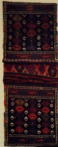
Xurcun. Yun. Xovsuz. 135x63. XX əsrin avvalları. Poladlı kəndi, Qobustan rayonu.