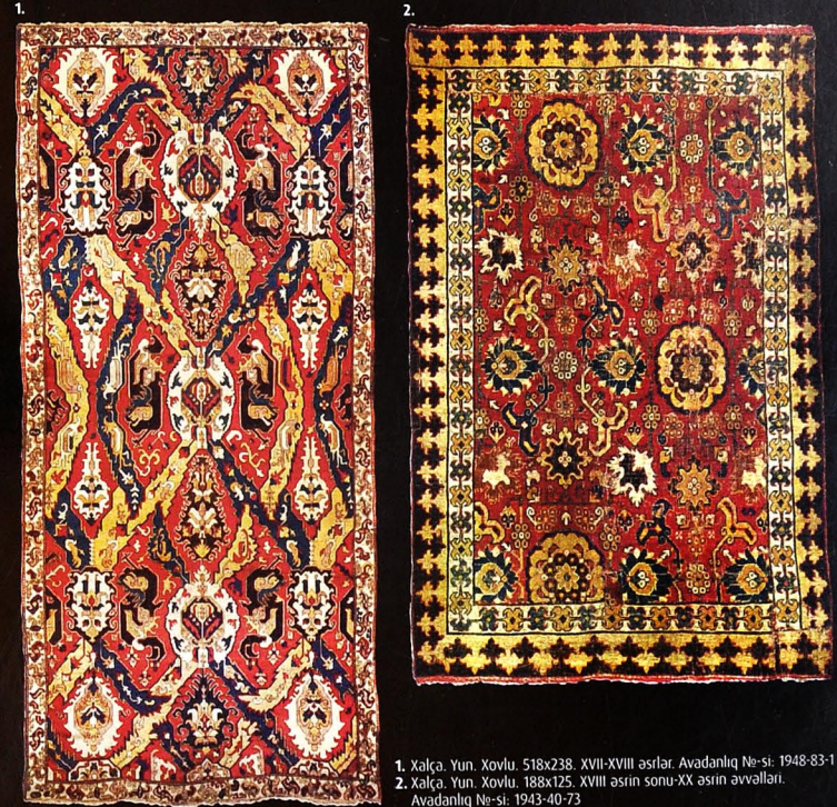
1. Xalça. Yun. Xovlu. 518x238. XVII-XVIII əsrlər. Avadanlıq №-si: 1948-83-1 2. Xalça. Yun. Xovlu. 188x125. XVIII əsrin sonu-XX əsrin əvvəlləri. Avadanlıq №-si: 1943-40-73

Filadelfiya İncəsənət Muzeyində qədim Azərbaycan xalçaları və xalça məmulatları da mühafizə edilir.