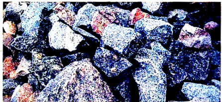
Ənənəvi inşaat materialları.

Bununla belə, Qəfri-Şirin müqaviləsinin bağlanmasıdan sonra tikinti işlərinin aparılması üçün əlverişli olan dinc dövr uzun sürmədi. XVII əsrin sonu – XVIII əsrin əvvəllərində bütün Yaxın və Orta Şərqi ölkələrini bürümüş dərin iqtisadi tənəzzül, böyük dağıntılarla müşayiət olunmuş Osmanlı işğallarının ağır nəticələri tikinti sahəsinin də