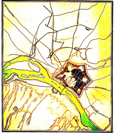
XIX əsrin əvvəllərində inşa edilmiş Abbasabad qalasının planı. Babək rayonu, Naxçıvan MİR.

ИЗНАЧЬ КРѢПОСТИ АБАСЪ АБАДА, СЪ ПОКАЗАНЫМЪ ПРОЗВЕДЕННОМЪ АТАКИ, МЕДЪ ВЪЗНУШНЫМЪ ПЕРИМАТОМЪ НАХЧЕВНА.