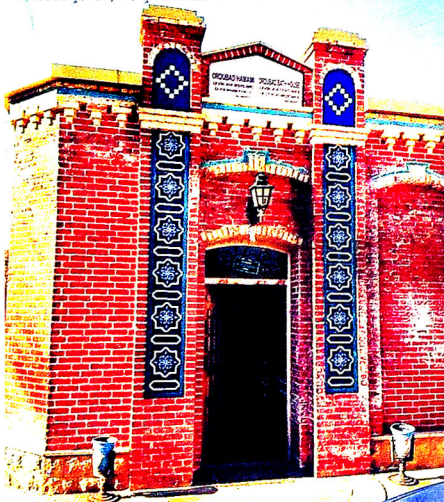
XVIII-XIX əsrlərdə inşa edilmiş Ordubad hamamı. Ordubad şəhəri, Naxçıvan MR.

Tədqiq olunan dövrdə Naxçıvan diyarında bəşmiş kərpicdən tikilən çoxlu sayda tikililərə də rast gəlmək mümkündür. Belə kərpiclər, adətən çiy kərpiclərin iri həcmli sobalarda bir neçə gün fasiləsiz bişirilməsi yolu ilə alınır. Bu yolla istehsal edilən kərpic gözəl görkəmə malik olmaqla yanaşı, tikinti üçün daha davamlı hesab edilirdi (5, s.192; 15, s.258-