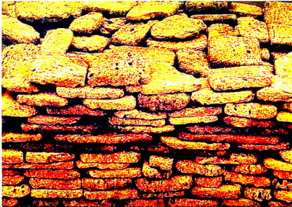
Ənənəvi inşaat materialları.

Rusiya-İran müharibələrinin başa çatmasından XX əsrin əvvəllərinə qədər davam etmiş ikinci mərhələdə bölgədə bərqərar olmuş siyasi sabitlik Naxçıvan diyarında tikinti sənətinin inkişafı üçün daha əlverişli şərait yaratmışdı. Bu özünü həm tikinti işlərinin həcminin, həm də bu sənətlə məşğul olan sənətkarların sayının artmasında göstərdi. Yazılı mənbələrin və epigrafiq abidələrin verdikləri məlumatlardan aydın olur ki, XIX-XX əsrin əvvəllərində Naxçıvan diyarında xeyli say-