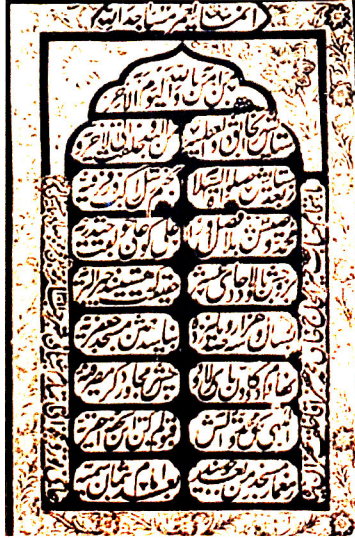
XVIII əsrdə inşa edilmiş Cəme məscidinin kitabəsi. Naxçıvan şəhəri, Naxçıvan MR.

Naxçıvan diyarında tikinti materialı kimi gəcdən də geniş istifadə edilirdi. Bu məhsula tələbatın olmasının nəticəsi idi ki, Naxçıvan qəzasında və Ordubad şəhərində xeyli sayda işçi onun istehsalı ilə məşğul olurdu. Ordubad şəhərində 1887-1892-ci