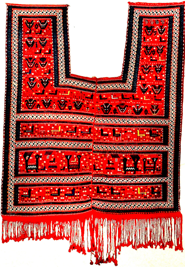
Şək. 1. Çul. XIX əsr. Şirvan