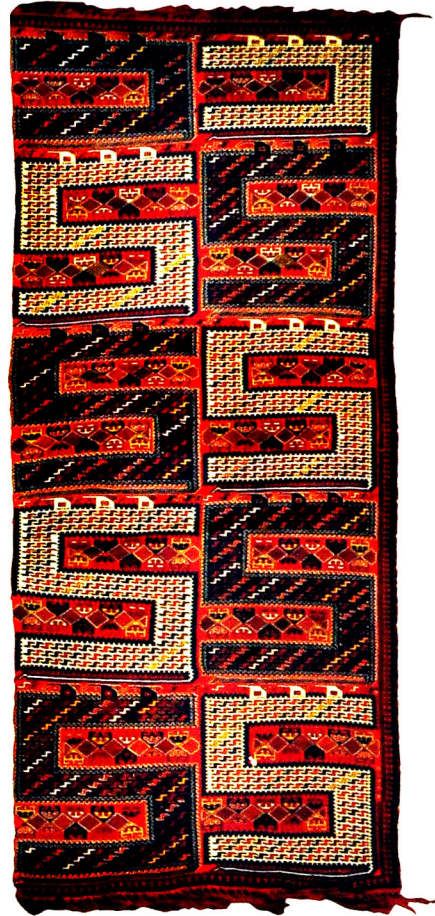
Şək. 2. Vərnə. XIX əsr. Qarabağ

Kolleksiyadakı xalçaların uzun illər öncə Azərbaycandan çıxarılmasının müxtəlif səbəbləri olmuşdur. Əksər hallarda bu xalçalar satın alınmışlar. Məsələn, XX əsrin əvvəllərindən – 1903, 1904, 1907, 1908, 1915, 1916, 1926 və daha sonrakı illərdə (XX əsrin 70-ci illərinə qədər) Sankt-Peterburqun Etnoqrafiya Muzeyinin əməkdaşları - A.A.Miller, N.N.Şavrov, K.A.İnostrantsev, K.Z.Kavtaradze, E.Q.Torçinskaya, E.N.Studenetskaya və digərləri tərəfindən Şuşa, Qazax, Naxçıvan, Quba, Bakı, Gədəbəy, Cəbrayıl, Şamaxı və başqa bölgələrə ekspedisiyalar təşkil edilmişdir. Bu bölgələrdə yaşayan əhalidən məşğul olduğu sənət növləri haqında məlumatlar toplanmış, onların əl işləri satın alınmışdır (1, s.96). Qeydlərdə göstərilir ki, xalça azərbaycanlıların məişətinin ayrılmaz hissəsidir. Bütün