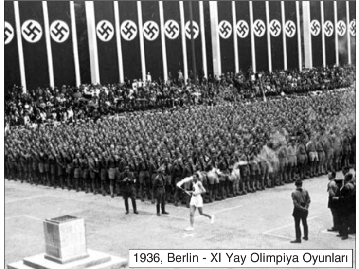
1936, Berlin - XI Yay Olimpiya Oyunları