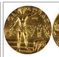
III Yay Olimpiya Oyunlarının qızıl medalı

İlk Olimpiya Oyunları zamanı stadionda məşəl əsasən kişi idmançı yandırır. Qadın idmançıları arasında ilk dəfə bu şərəfə 1968-ci ildə Meksikada keçirilən olimpiadada meksikalı Enriketta Basilio Sotelo layiq görülmüşdür. Maraqlıdır ki, BOK rəhbərliyi məşəl əlində tutan idmançıyı seçəndə əsasən onun ad-sanına, qazandığı uğurlara və yarışqılı olmasına fikir verir. Ancaq 1958-ci ildə Melbourne Olimpiadasında məşəl 18 yaşlı, heç kimin tanımadığı avstraliyalı Ronald Klark yandırmışdı.