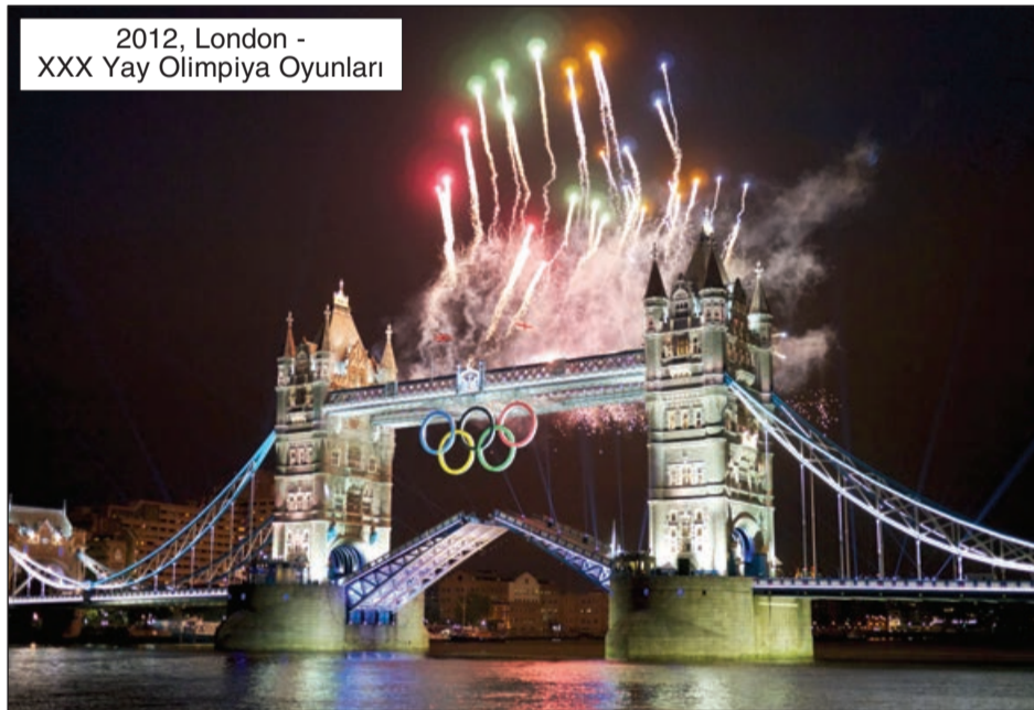
2012, London - XXX Yay Olimpiya Oyunları