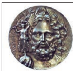
I Yay Olimpiya Oyunlarının qızıl medalı