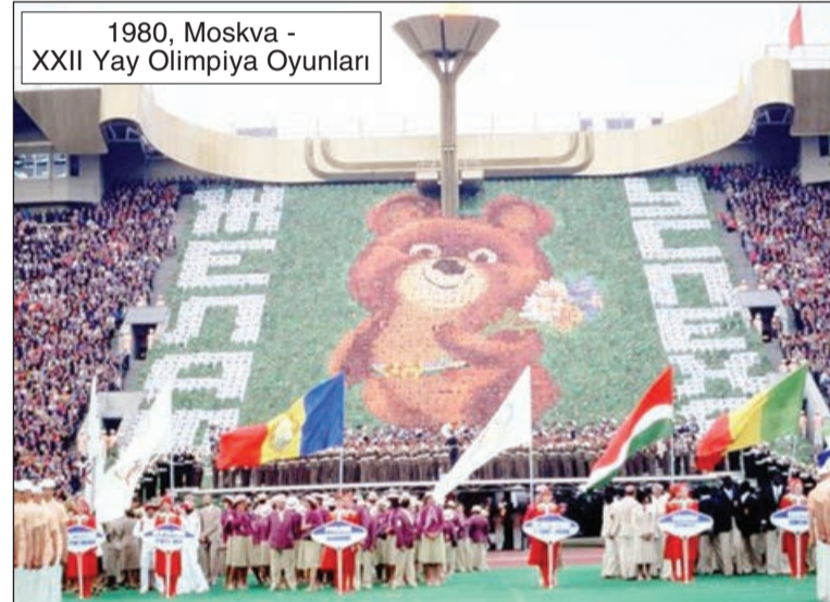
1980, Moskva - XXII Yay Olimpiya Oyunları

xalq Olimpiya Komitəsi yaradıldı. Onun tərkibinə Konqresdə iştirak edən ölkələrin (13 ölkənin) nümayəndələrindən fransız, yunan, ingilis, rus, isveç, amerikalı, ispan və macarlar BOK-un yaradılmasına səs verdilər.