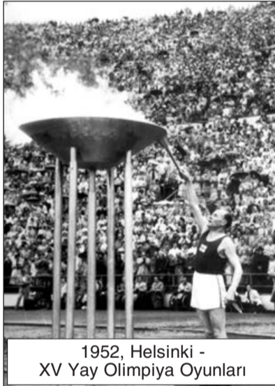
1952, Helsinki - XV Yay Olimpiya Oyunları