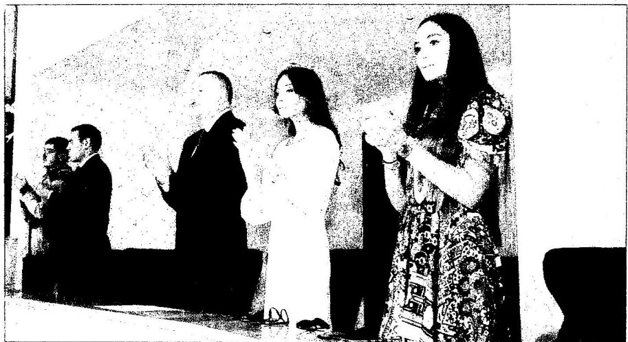
Əvvəlki 1-ci səh.

İlk yarış günündə cüdədə 9 çəki dərəcəsinə mükafatçılar müəyyənləşib. Kişilərdə 60, 66 və 73 kq, qadınlarda 48, 52, 57 və 60 kq, paracüdədə isə qadınlarda 57 və 70 kq çəki dərəcələrində tatami üzərinə çıxıblar.