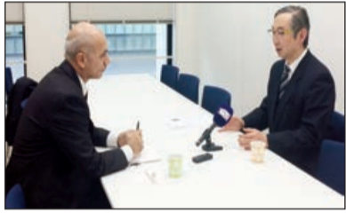
"Ermənistan ordusu uzun illərdir ki, işğal altında saxladığı Dağlıq Qarabağ və Azərbaycanın digər ərazilərini dərhal və qeyd-şərtsiz olaraq tərk etməlidir".

"Bu məqaləyə şərhim hələ də hesabımdadır. Fransanın bu münasibətə bağlı 30 illik rəsmi mövqeyini göstərmək istəyirdim. Fransa özünün qəbul etdiyi BMT qətnamələrini dəstəkləyir. Baş a düşdüm ki, bu gün Fransıda Ermənistanın müvafiqi təsdiqləmədən Azərbaycanla Ermənistan arasındakı vəziyyəti müzakirə etmək mümkün deyil. Əks halda, belə radikal reaksiyalarla üzləşəcəksən. Bəzi ermənilər TF1-in qaragahı qarşısında Fransa tərəfindən Azərbaycanda hazırlanan yeganə reportaja etiraz olaraq nümayiş isə ölkəmizdəki radikallığın dərəcəsini göstərir!" - deyir J.Lamber bildirib. O vurğulayıb ki, dünyada sülh uğrunda mübarizəsini davam etdirəcək.