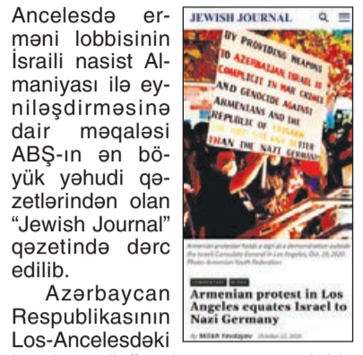
Ancelesdə erməni lobbisinin İsraili nasist Almaniya ilə eyniləşdirməsinə dair məqaləsi ABŞ-ın ən böyük yəhudi qəzetlərindən olan "Jewish Journal" qəzetində dərc edilib.