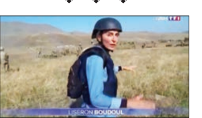
"Sərhədsiz Reportyorlar" Fransanın TF1 televiziyaşının jurnalistinin Dağlıq Qarabağ münasibəti haqqında hazırladığı reportajın yayımından sonra ona qarşı internet üzərindən gətirilən böyük hücumların olduğunu, yəhudi işini görən bir peşəkara qarşı kobud nifrət dolu məsajlarla ittiham olunduğunu bəyan edib.