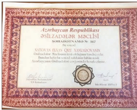
Əsilzadələr məclisinin şəhadətnaməsi