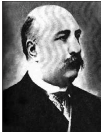
Azərbaycanın ilk kimyaçı alimi Məvsüm bəy Xanlarov

Onların əsas yaşayış yeri içəri şəhər idi. Qala divarları ilə əhatələnmiş bu əsrəngiz şəhərdə Xanlarov nəslinə məxsus, indi memarlıq abidəsi hesab edilən mülkləri olub. Xanlarovların Quba qəzasında böyük torpaq sahələri və bir sıra yaşayış məskənləri, eləcə də Abşeron kəndləri - Xırdalan, Masazır, Pirekəşkül, Hökməli, Masşağa, Mərdəkan, Şüvəlan kəndlərində tor-