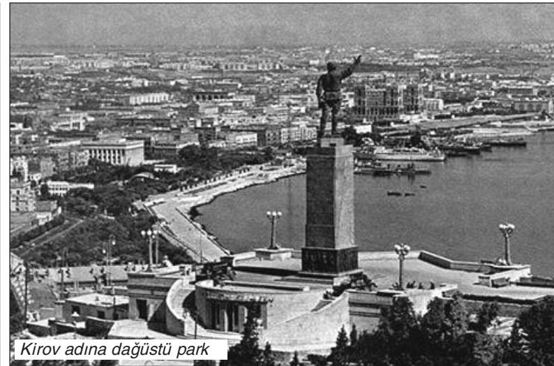
Kirov adına dağüstü park