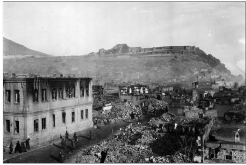
Dağıdılmış türk qəsəbəsi

Rusiya ermənilərə etibar etmədiyini və onların separatçılığının güclənəcəyindən narahat olduğu üçün işğal edilən ərazilərdə ermənilərin yerləşməsinə artıq qədd edildiyi kimi, icazə vermədi. 1916-cı il aprelin 2-də polkovnik (arxiv sənədində adı yazılmayıb - M.Q.) Qafqazın İran və Türkiyə ilə yaxın hissələrində ermənilərin torpaq alması məsələsinə dair yazdığı məxfi arayışında qeyd edirdi: "Erməni hərəkatı ilə tanış olan çoxlu şəxslər fikrincə, Türkiyə və İranda qədim erməni abidələrinin arxeoloji baxımdan öyrənilməsinə və tədqiqinə marağın artması diyarın təbii sərvətlərinə yiyələnmək üçün öyrənmək məqsədi daşıyır. Bu fikirlərin nə qədər doğru olduğunu zaman göstərəcəkdir, ancaq bu, şübhə doğurmur. 1914-cü ilin ikinci yarısından erməni hərəkatının daha çox artdığı bir dövrdə ermənilər Trapezunddan Kilikiyaya və Ankaradan Urmiyayə qədər olan ərazi-