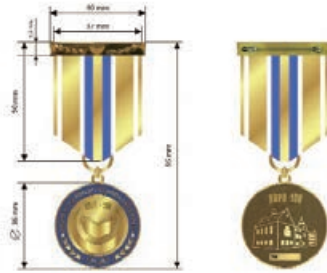
“Azərbaycan Dövlət Pedaqoji Universitetinin 100 illiyi (1921-2021)” Azərbaycan Respublikasının yubiley medalı

2.3. Medalın daxili çevrəsinin üzərində qızılı rəngli fonda ucları aşağıdan yuxarıya uzanan aypara və onun mərkəzində təhsili simvolizə edən kitab emblemindən ibarət kompozisiya təsvir olunmuşdur. Həmin kompozisiyanın yuxarı hissəsinə loqotip şəklində “ADPU - 100” sözləri həkk edilmişdir.