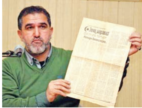
Bu köç hayana gedir?!

"...Ümumiyyətlə, siyasətdə var olmamızın mahiyyəti nədir?! Qarabağ, Vətən torpaqlarımızın bütövlüyü. Azərbaycan xalqına bu xoşbəxtliyi müzəffər Ali Baş Komandan İlham Əliyev yaşadı. İlham Əliyev bizə göz yaşı, ürək dağı ilə yaşadığımız 30 ilin əvəzini Zəfərlə, milli qürurla qaytardı. Bu xalqa qələbə daddırdı, bu xalqı böyütdü... Daha bizdə 2020-ci il 26 sentyabr təfəkkürü yoxdur, heç zaman da olmayacaq. 26 sentyabrda biz başqa xalq iddik, 27 sentyabrda başqa xalq olduq. 8 noyabrda isə biz artıq müzəffər liderin qalib xalqı iddik. Bu bir tarixdir və Azərbaycan xalqının qürur zirvəsi kimi salnamələrə qızıl hərfərlə həkk olundu..."