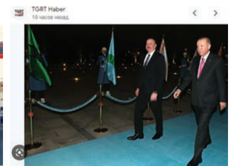
Gərdəşə samimi qarşılaşma: Cumhurbaşkanı Erdoğan, Aliyev ilə bir araya gəldi - TGRT Haber