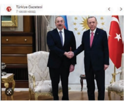
Son dakika: Cumhurbaşkanı Erdoğan, Azərbaycan Cumhurbaşkanı Aliyev ilə bir araya gəldi - Türkiye...