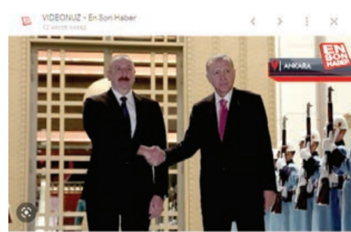
Cumhurbaşkanı Erdoğan, Azərbaycan Cumhurbaşkanı Aliyev ilə görüşdü