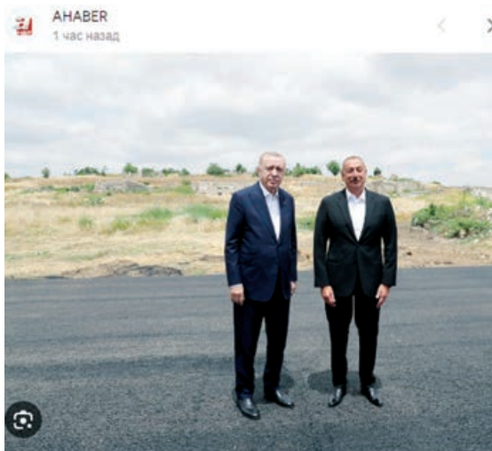
Azeri Prezidenti İlham Əliyevdən Türkiyə Prezidenti Rəcəb Tayyib Ərdoğan'a təbrik telefonu: Türkiyə xalqı liderinə güvənini...

Bu mövzu türk KİV-nin diqqətini cəlb edib və geniş işıqlandırılıb. Rəcəb Tayyib Ərdoğanı ilk təbrik edən liderin məhz Prezident İlham Əliyev olması barədə onlarla teleşirkət, qəzet və internet portalı xəbərlər paylaşılıb.