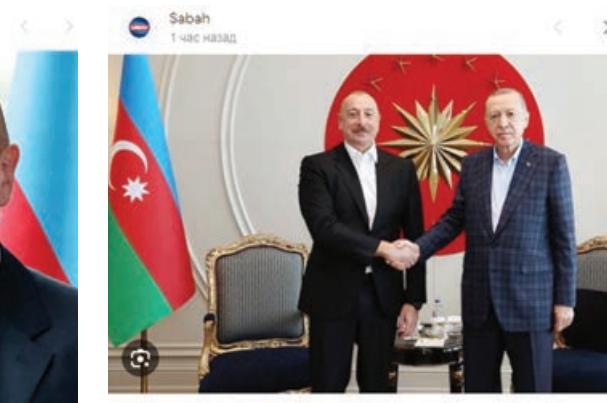
İlham Aliyev, Cumhurbaşkanı Erdoğan'ı kutladı - Son Dakika Haberleri