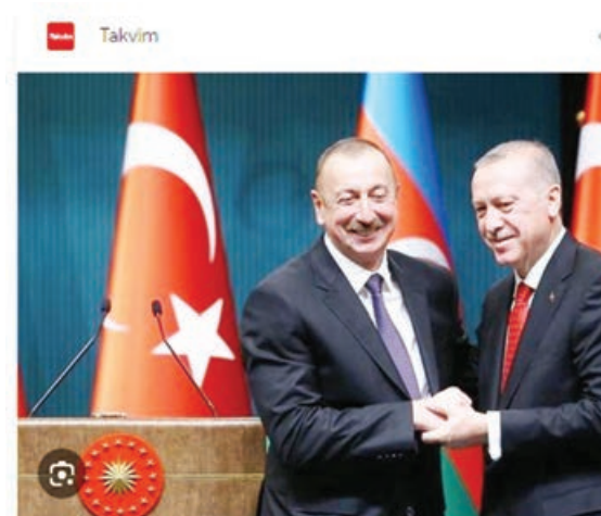
Son dakika: Azeri Cumhurbaşkanı İlham Aliyev, Başkan Recep Tayyip Erdoğan'ı kutladı - Takvim