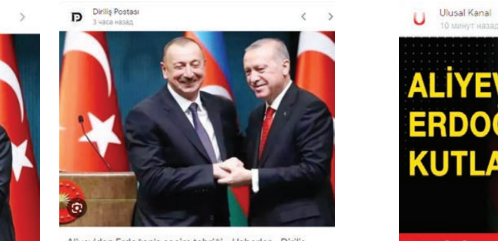
Aliyev'den Erdoğan'a seçim tebriği - Haberler - Diriliş Postası