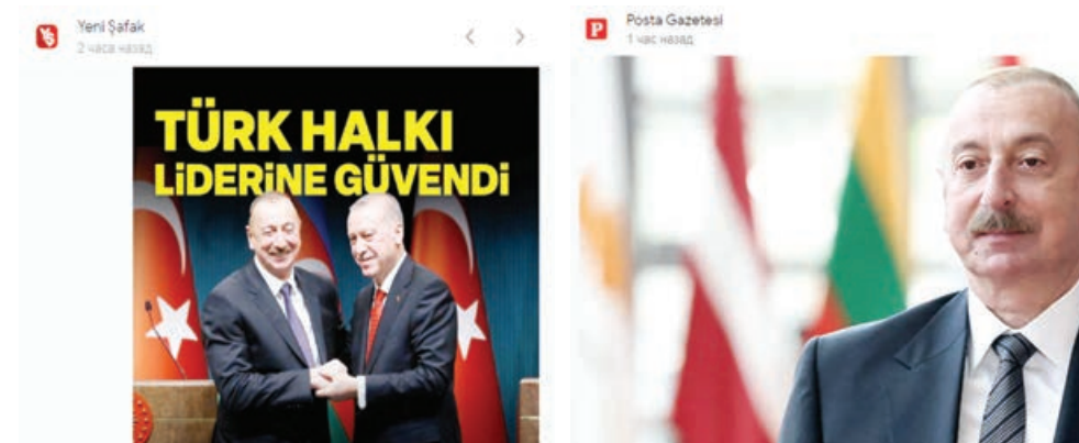
Seçim sonrası Aliyev, Erdoğan'ı aradı - Dünya Haberleri