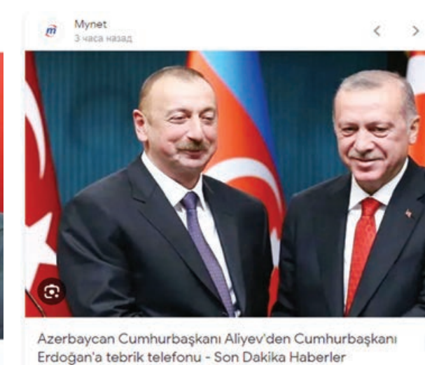
Azeri Cumhurbaşkanı Aliyev'den Cumhurbaşkanı Erdoğan'a tebrik telefonu - Son Dakika Haberleri

"Axşam" qəzeti isə "Türkiyə xalqı liderinə güvəndiyini göstərdi" başlıqlı xəbəri oxuculara çatdırıb. Bildirilib ki, Prezident Ərdoğanın ilk təbrik telefonu zəngi Azərbaycan Prezidenti İlham Əliyevdən gəlib.