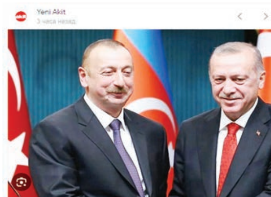
Aliyev, Cumhurbaşkanı Erdoğan'ı kutladı - Yeni Akit