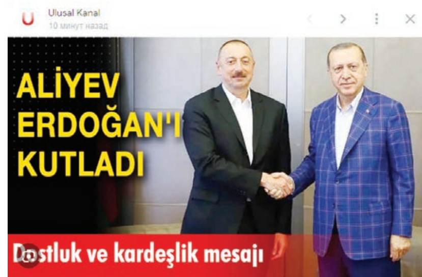
Dostluk ve kardeşlik mesajı