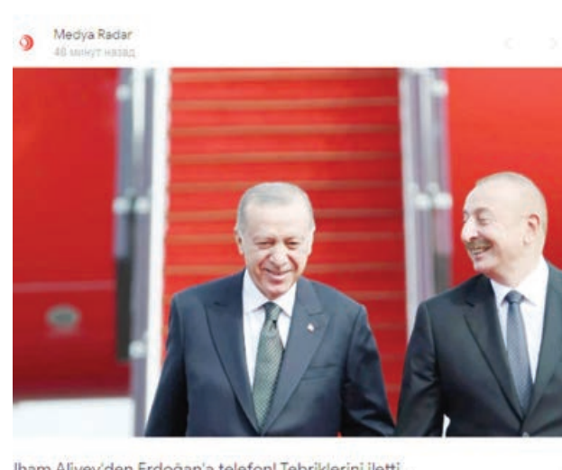
İlham Aliyev'den Erdoğan'a telefon! Tebriklerini ilettiler...