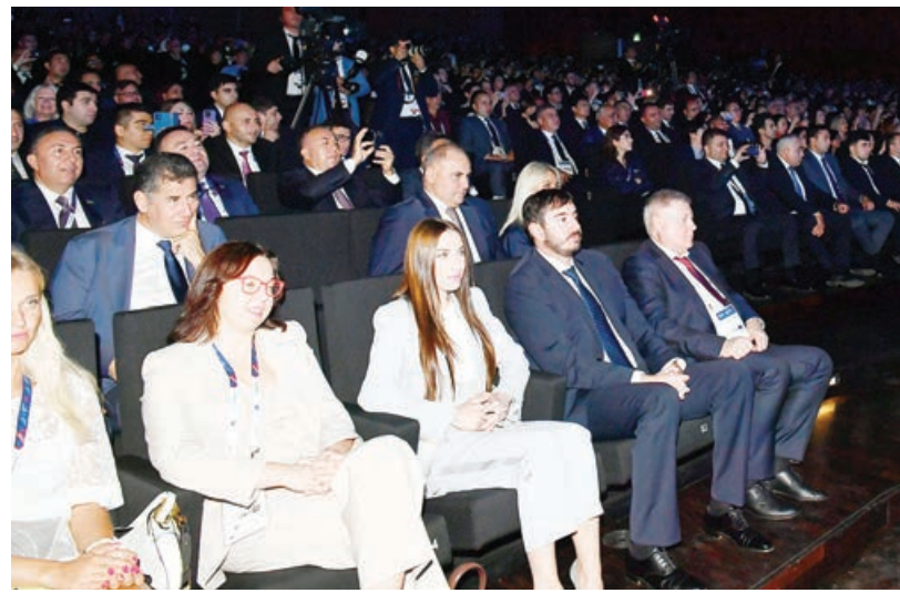
Əvvəl 2-ci sah.

Biz öz təbii sərvətlərimizin istismarına hələ başlamamışıq. Açıq dənizə çıxışı olmayan ölkəmizdə hərə-mərclik hökm sürürdü və gələcək üçün perspektivlər o qədər də aydın görünmürdü.