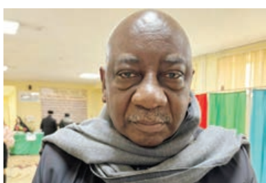
Pedro De Morais Neto,

- Seçki prosesini müşahidə zamanı vətəndaşların göstərdikləri fəallıq, onların seçkiyə göstərdikləri diqqət, prosesin yüksək səviyyədə təşkil olunması bizi məmnun etdi. Növbədənkonar prezident seçkiləri uğurlu başa çatdı. Biz qanun pozuntusu ilə rastlaşmadıq. Buna görə Azərbaycan xalqını təbrik edirəm. Həmçinin bizə göstərilən qonaqpərvər münasibətə görə dərin təşəkkürümü bildirirəm.