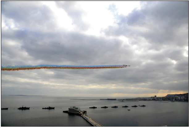
(Əvvəli 8-ci səh.)

Ölkə başçısı sonda deyib: "Öz çıxışımı məşhur kəlamla yekunlaşdırmaq istərdim. Hər kəs bilir ki, Ermənistan rəhbərliyi bir il bundan əvvəl demişdi ki, "Qarabağ Ermənistanıdır və nöqtə". Mən isə demişdim ki, "Qarabağ Azərbaycanıdır və nida". Bu gün bütün dünya görür ki, Qarabağ Azərbaycandır! Qarabağ bizimdir! Qarabağ Azərbaycandır! Eşq olsun Azərbaycan Ordusuna! Yaşasın Türkiyə-Azərbaycan dostluğu, qardaşlığı! Yaşasın Azərbaycan əsgəri!