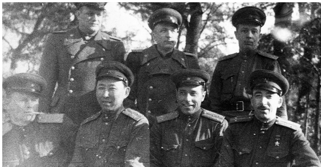
Школа КГБ, 1950 г., Гейдар Алиев (второй справа в переднем ряду)

этому и преподавание русского языка было хорошо поставлено. Гейдар начал изучать русский язык в техникуме. Я помню, как-то Абдулазим бек сказал мне: