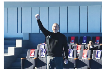
Президент Азербайджана Ильхам Алиев

Азербайджан в настоящий момент ближе к миру с Арменией, чем когда-либо ранее. Соответствующую точку зрения, как передает РИА Новости, выразил азербайджанский президент Ильхам Алиев «Баку сейчас ближе к миру с Ереваном, чем когда-либо ранее, заявил Алиев», — говорит: