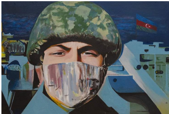
III 5. Mirzə Həbib Quliyev “Zəfər” (2021) (kətan, yağlı boya, 70x103 sm)