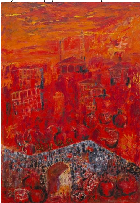
III 7. Səyyar Əliyev “Şuşa həsrəti” (2021) (kətan, yağlı boya, 100x70 sm)

8 noyabr Şuşada qazanılan tarixi uğur rəssamlarımızın yaradıcılığında yeni mərhələ təşkil edir. Səyyar Əliyevin əsərində Şuşa həsrəti artıq bitmişdi. Nar meyvələrin, Şuşa şəhərlərimizin zirvə mənasında təqdim edilmişdi. Qırmızı rəngin əhatə etdiyi əsərdə Şuşanın memarlıq abidələri əsas diqqət mərkəzindədir. (ill 7)