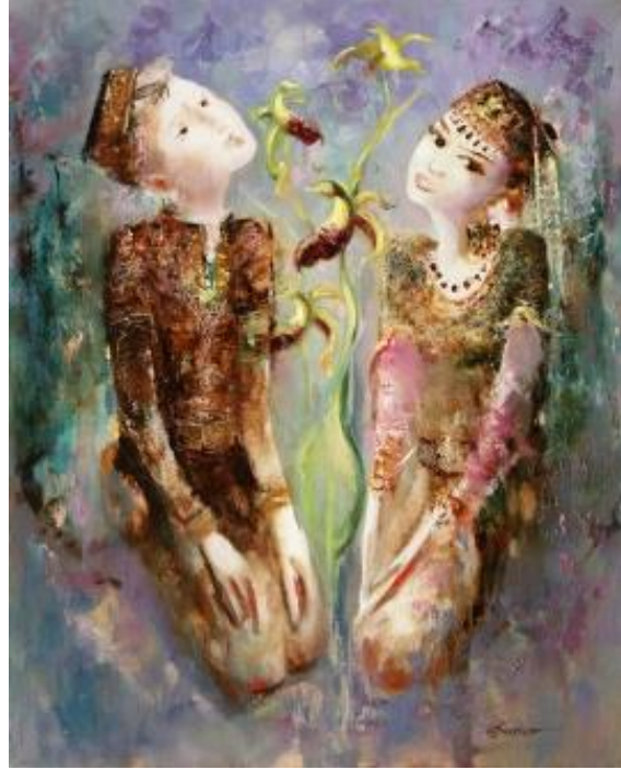
İll 3. Natiq Fərəcullazadə “Xarıbülül” (2020) (kətan, yağlı boya)

işlənəsi, zərgərlik nümunələrinin təsviri xüsusi obrazlılığı ilə seçilir. Çiçək açan xarıbülül isə azad torpaqlarımıza yeni nəfəs gəldiyinə işarədir.