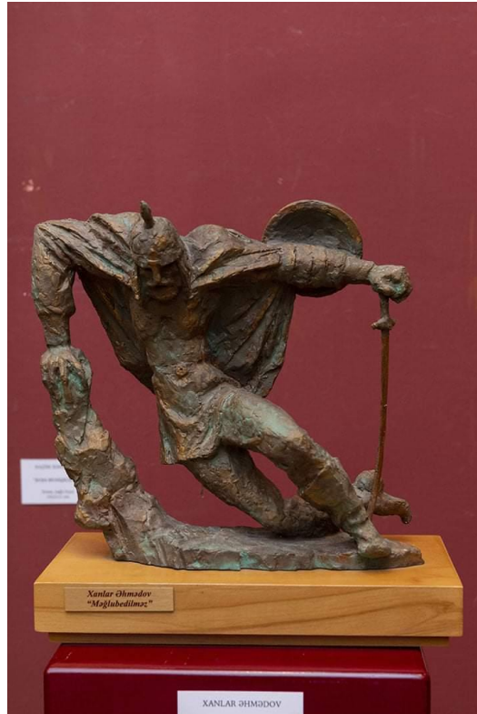
İll 2. Xanlar Əhmədov “Məğlubedilməz” (polyester, 30x25x15 sm)

“Məğlubedilməz”(ill 2) əsəri vətənpərvərlik, mübarizlik ideyası ilə yüklənmişdir. Xanlar Əhmədov müharibədə yaralansada öz mübarizəsini davam etdirən məğlubedilməz obrazı təqdim etmişdi. Döyüş geyimi, əllərinin kobud fakturası, ümumiyyətlə əsərin ümumi həlli müharibə səhnəsini gözümüzün qarşısında canlandırır.