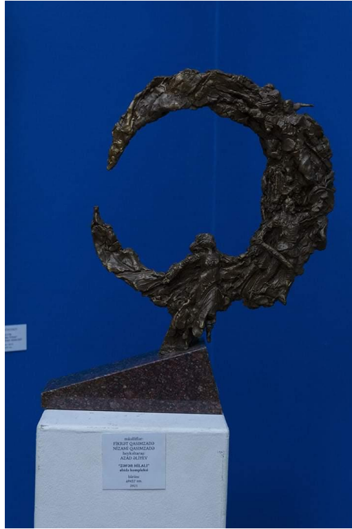
İll 1. Azad Əliyev “Zəfər hilal” abidə kompleksi (2021) (bürünc, 40x57 sm)

“Məğlubedilməz”(ill 2) əsəri vətənpərvərlik, mübarizlik ideyası ilə yüklənmişdir. Xanlar Əhmədov müharibədə yaralansada öz mübarizəsini davam etdirən məğlubedilməz obrazı təqdim etmişdi. Döyüş geyimi, əllərinin kobud fakturası, ümumiyyətlə əsərin ümumi həlli müharibə səhnəsini gözümüzün qarşısında canlandırır.