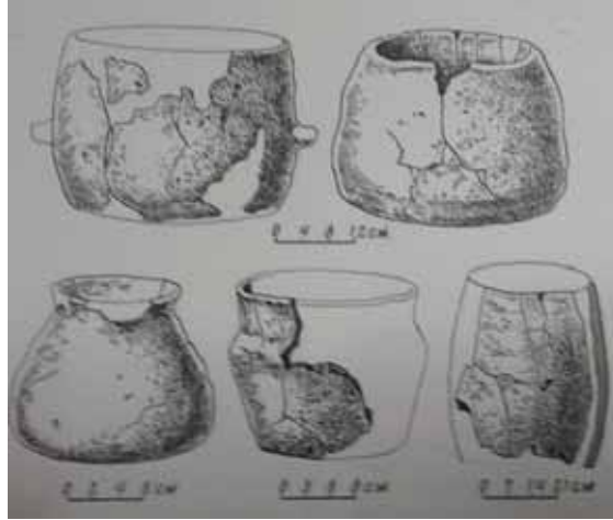
Şək. 1.I Kültəpə abidəsindən tapılmış yerli gil məmulatı

binalarının hamısında ocaq yerləri və təsərrüfat quyuları üzə çıxarılmışdı. Diqqəti cəlb edən məsələlərdən biri ondan ibarətdir ki, dairəvi formalı məişət və təsərrüfat tikililəri Azərbaycanın, eləcə də bütün Cənubi Qafqazın abidələri üçün səciyyəvi sayılır (13). Onların tikintisində saman qatışıqlı gil möhrədən və çiy kərpiclərdən istifadə olunmuşdu.