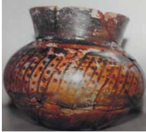
Şək. 3.1 Kültəpə abidəsindən tapılmış Xələf mədəniyyətinə aid qıl qapaq nümunələri