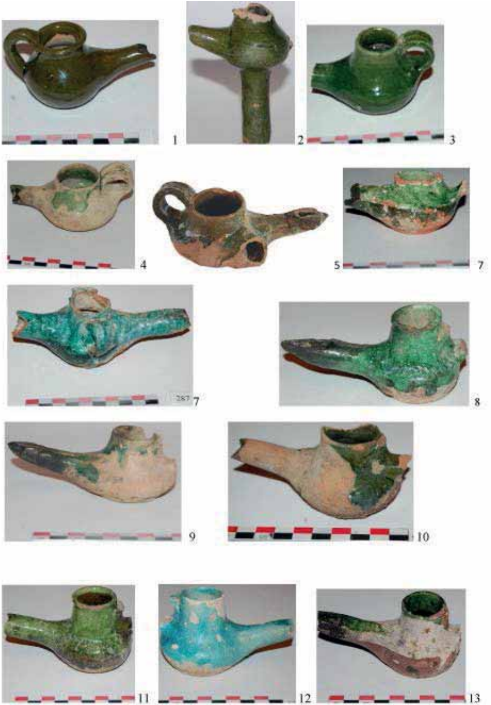
IV Tablo. Şirli çıraqlar