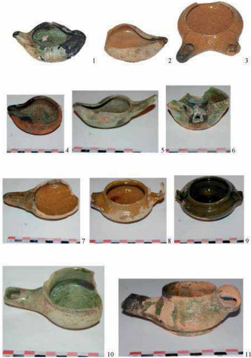
I Tablo. 1-2, 4- 6 –şirli saxsı piydanlar. 3,7- 11- şirli saxsı piydan-çıraq

Piydan-çıraqlarda yanacaq kimi zeytun yağından istifadə olunduğunu ehtimal etmək olar. Qurani-Kərimdə “Ən-Nur” surəsində zeytun ağacının müqəddəs ağac olması, zeytun yağının parlaq işıq saçdığına işarə edilir (Qurani-Kərim, 24, Ən-Nur surəsi, 35).