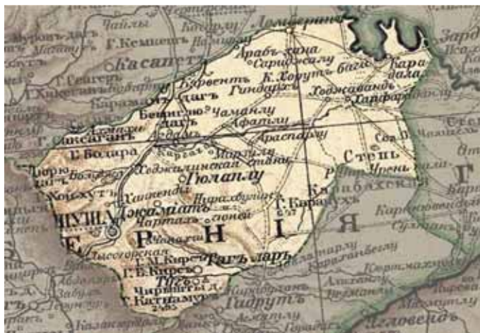
Рис.6. Село Туг на карте Елизаветпольской губернии.