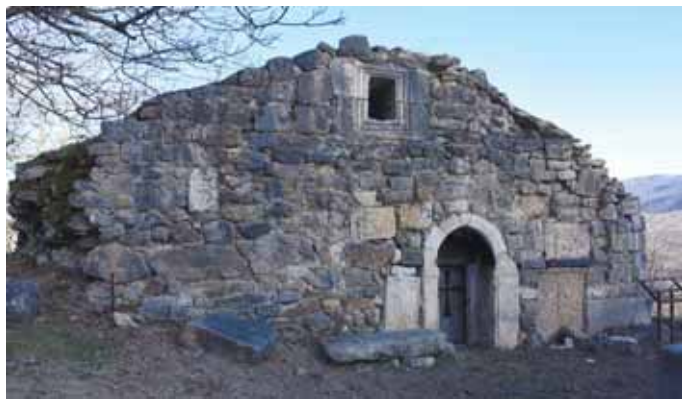
Рис.4. Церковь Св.Первомученика Степанноса