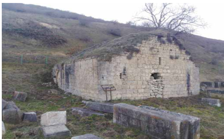
Рис.5. Женский монастырь Анапат

Анапат (так называлась безымянная церковь, часовня или скит, строившиеся вне селения) находится на кладбище в северо-западной части села Туг «каменная с известью церковь, построенная на одном своде. Возле церкви видны преддверья, обломки келий и жилищ. Этот скит был женским монастырем». Здесь находилась могила мелика Бахтама сына мелика Атама [8, ч.I, 74].