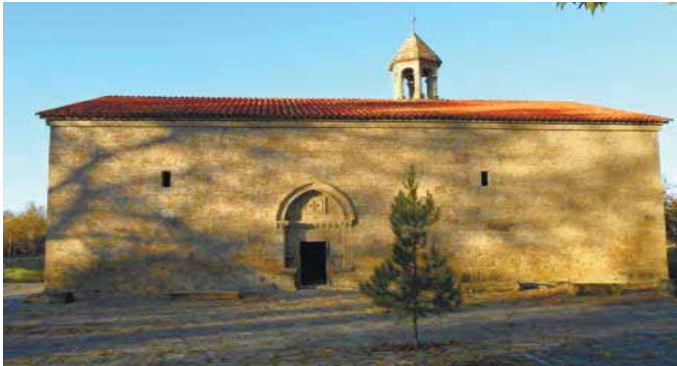
Рис.3. Село Нидж. Церковь Св. Елисея (Джотари) XVIII в.

часовня как усыпальница меликского рода, в которой были погребены: архимандрит Мелик Гукас в 1154 (1705) г., Мелик-Еган в 1193 (1744) г., Мелик Арам в 1194 (1745), Мелик Есаи в 1230 (1781) г.» [8, ч. I, 73].