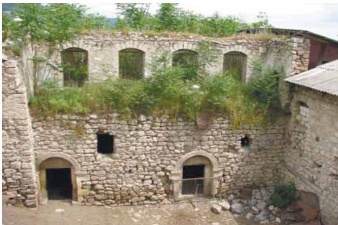
Рис.7. Развалины меликского дворца