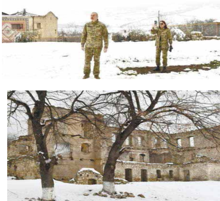
Рис.1. Президент Азербайджана и Доблестный Верховный Главнокомандующий Азербайджанской армии Ильхам Алиев и Первый Вице-президент Азербайджана Мехрибан Алиева возле школы села Туг. 15 марта 2021

несколько предположений: «вершина горы» (что соответствует его географическому расположению), «флаг», «форт». О древности села свидетельствовало сохранившееся до 90-х гг. XX в. древнее дохристианское кладбище.