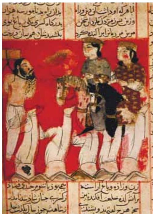
Рис. 2. Изображения казни Маздака, персидская миниатюра из произведении Шахнаме, Фирдоуси [14]

Исторические и социальные условия маздакитского движения слишком сложна, чтобы ее подробно рассматривать здесь; достаточно сказать, что кажется несомненным, что они сыграли решающую роль в успехе Кавада против знати. Однако ситуация не могла быть такой простой, как если бы промаздакитское население столкнулось с объединенной антимаздакитской знатью. В чем суть, маздакитского движения и до какой степени Кавад искренне верил в него - или, скорее, использовал его макиавеллистским способом для увеличения своей собственной власти - невозможно выяснить [13]. Но, сделав Маздака своим советником, Кавад I, с помощью маздакитов рассчитывал ослабить знать и обуздать жречество, вмешательство в государственные дела зашло слишком далеко. Однако противники в 496 г. н.э. взяли верх, и Каваду I пришлось бежать к тюркскому царю эфталитов Ахшунвару. Породнившись с ним, шах вернулся в Эраншахр с иноземным войском и в 499 г. н.э. вновь овладел тронном шаханшаха. Кроме эфталитов его поддержала часть знати и царский род. Самых опасных противников он казнил, с другими смог договориться. Успехи в военных действиях – война с Византией 502-506 гг. н.э. поход на современные территории Армении – способствовали обогащению войска, пополнению казны, укреплению авторитета Кавада. Теперь он уже не нуждался в поддержке маздакитов; в новых условиях политика шаханшаха была направлена на их ослабление. Окончательную расправу с ними,