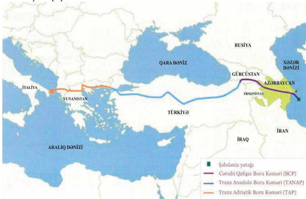
Şək. 1. TANAP və TAP layihələri

TANAP-a birləşən, Yunanıstan, Albaniya və Adriatik dənizindən keçən və İtaliyada başa çatan əsas ixrac marşrutu kimi seçilməsi də tarixi hadisə olunur (şəkil 1). Boru kəmərinin uzunluğu 878 km təşkil edəcək və fəaliyyətə başlaması 2020-ci ilə planlaşdırılır. İlk nəql qabiliyyətinin 10 mlrd. m 3 olması nəzərdə tutulmuşdur [1].