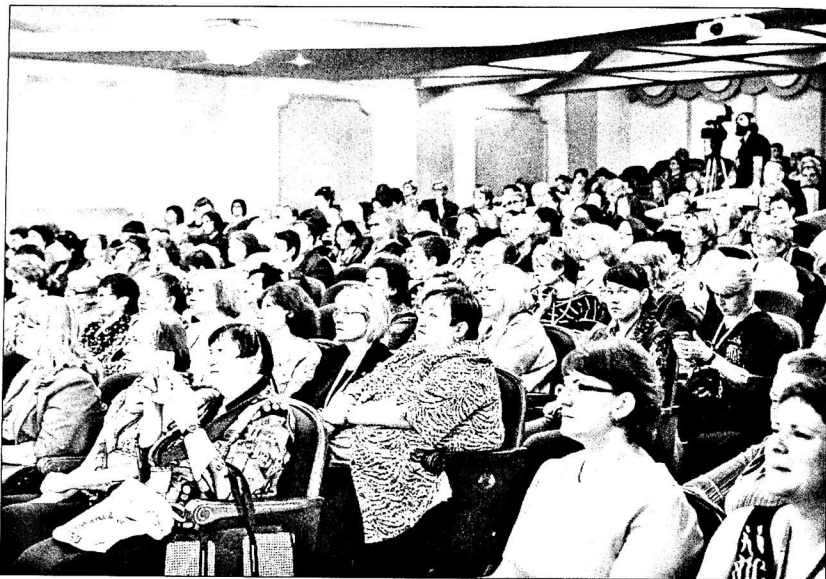
Участники торжественного заседания РБА в Туле

ства и профессионального сообщества в данном вопросе.