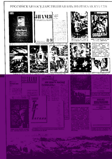
Планшет выставки РГБИ «Волжский рубеж в культурной памяти»

Предложенный библиографом план выставки структурировал структуру выставок: «Общие публикации об истории Сталинграда, Сталинградской битве, в том числе воспоминания»; «Фотоальбомы, посвящённые Великой Отечественной войне, включающие материалы о Сталинградской битве»; «Сталинградская битва в художественной литерату-