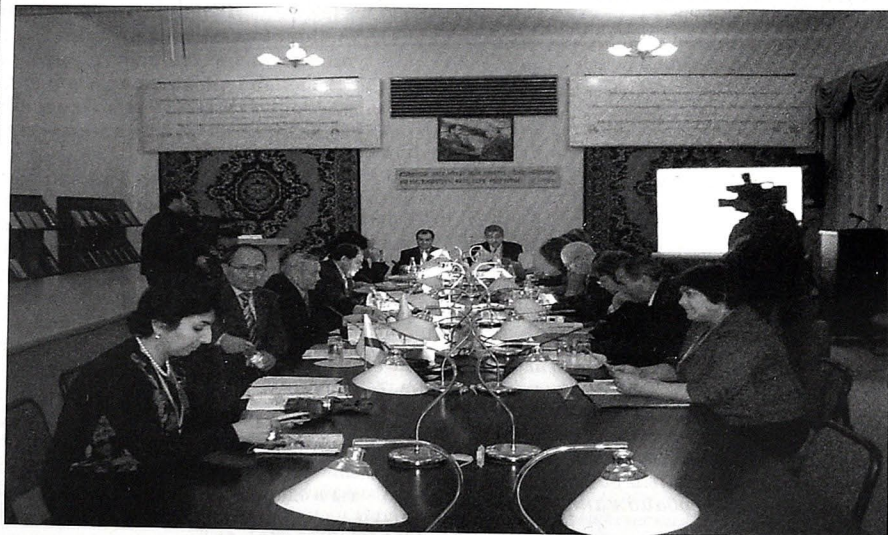
На 10-м Общем собрании некоммерческого партнерства «Библиотечная Ассамблея Евразии»

Здание НБ выходит на улицу Хагани (с прекрасным видом на сад Сахил), на проспект Рашида Бейбутова и на улицу Низами. Фасады, выходящие на улицу Хагани и проспект Рашида Бейбутова, украшены расположенными на большой террасе в живописных лоджиях статуя-