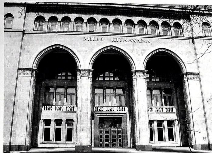
Азербайджанская национальная библиотека им. М.Ф. Ахундова. 2008 г.

ми выдающихся деятелей отечественной и мировой культуры — Низами Гянджеви, Шоты Руставели, А.С. Пушкина, Д.И. Менделеева, Гасанбека Меликова-Зардаби, А.М. Горького, Узеира Гаджибекова, Самеда Вургунга, Мехсети, Насими, Ниязи, Бюль-бюля, Расула Рзы, А. Нахичивани, Султана Мухаммеда, М.А. Сабира и др. Эти имена как бы подчеркивают универсальность фондов библиотеки, отражают всесторонность, многообразие национальной культуры — преемницы великого классического наследия.