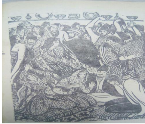
Şəkil 3. "Molla Sadıqın evi"

"Şahnigar xanım"(Şəkil4) - kompozisiyasında rəssam günəşli Göytəpə kəndinin qarşısında qəmli, lirik baxışlarıyla seçilən Şahnigar və torpağın altında isə kəfənə bükülmüş şəkildə dəfn edilən bəxtsiz qadın obrazı canlandırılmışdır. Cahandar ağanın öz bacısını, günəşli, Kürün qolunun ayrılması vaxtı öldürməsi Maral Rəhmanzadə bir daha təsvir dili ilə bu hadisəni əks etdirmişdir.