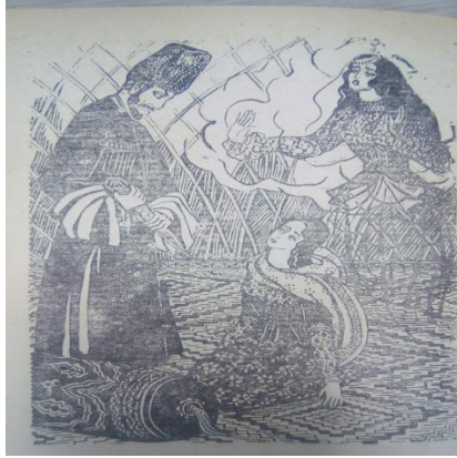
Şəkil 6. “Şübhə”

Növbəti səhnədə Salatın Allahyar tərəfindən qaçırıldıqdan sonra, evə gətirilən qızının namusunun təmiz olmasına şübhə edən Cahandar ağa xəncəri çıxarıb onu ödürmək istəyir. Obrazların baxışları əsərdə baş verən hadisələrin rəssam tərəfindən düzgün şəkildə çatdırılmasına xidmət edir. Şahnigarın isə ruh şəkildə qardaşına qızının namusunun təmiz olmasını bildirməsi, onu özü kimi günahsız şəkildə öldürməməsinin qarşısını alır. Ağ-qara ornamentlərin ritmik təkrarlanması, obrazların mimika və jestləri bu kompozisiyada xüsusilə vurğulanmalıdır. (Şəkil 6)