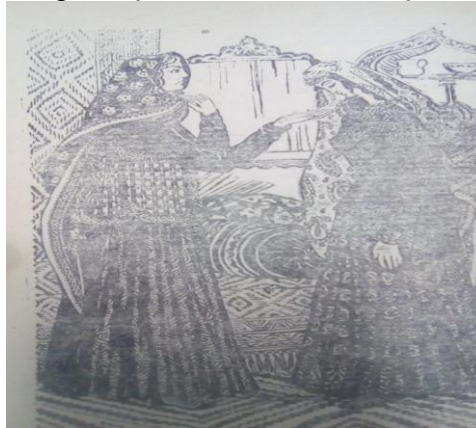
Şəkil 2. “Zərnigar xanımın qəzəbi”