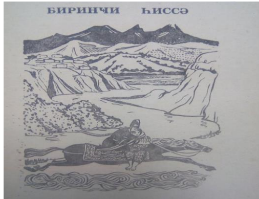
Şəkil1. “Cahandar ağanın Mələyi qaçırması”

“Dəli Kür” romanına çəkilmiş illüstrasiyalar. 1982-ci ildə romanın yenidən nəşr olunması ilə bərabər, bu dəfəki sayında yenilik əsərə bir neçə maraqlı illüstrasiyalar da rəssam tərəfindən təsvir edilmişdir. “Cahandar ağanın Mələyi qaçırması” ( Şəkil1 ) əsərində Göytəpə kəndinin ümumi mənzərəsi canlandırılmışdır. Əsas diqqət isə Cahandar ağanın Kürün sahilində bir neçə dəfə görüb aşiq olduğu Mələyi götürüb qaçma səhnəsidir. Atın dinamikası, üzərində əyləşən Cahandar ağanın məsum, yazıq, öz taleyində baş verən hadisələrlə əsərdə diqqəti çəkən Mələyi qucaqlamışdır. Kompozisiyada miniatür ənənələri diqqəti cəlb edir. Kürün spiralvari formada verilməsi, obrazların üzündəki ifadəliyin şərtiliyi ənənəvi incəsənətin qrafika sənətində də xüsusi yeri olduğunu göstərir.