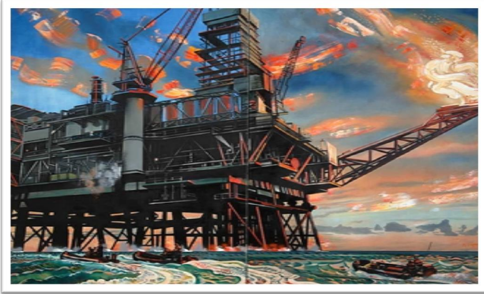
İll 2. T. Salahov “Xəzər bu gün. Odlar yurdu” triptixinin mərkəzi hissəsi (2007)

Sərt üslubun görkəmli nümayəndəsi xalq rəssamı Tahir Salahov yaradıcılığında Xəzər dənizi fırçanın çılğın, coşqun texnikasıyla yerinə yetirilib. “Xəzər bu gün. Odlar yurdu” (2007) (ill 2) triptixinin mərkəzi hissəsində neft daşlarının iri formada verilməsi təsadüf deyildir. Bu güclü, inkişafda olan dövlətin simvoludur. Alovun səmada cəngi ifası odlar yurdunun qələbəsidir. Rəng fakturası əsərdə çəvik, dinamikdir.