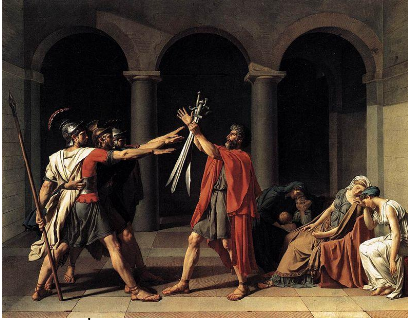
İLL 3. Jak Lui David “Horatsilərin andı”

“Jan Öqüst Dominik Enqr:xətt incəsənəti” mövzusunda fransız klassisizminin nümayəndələrindən biri tarixi və portret janrının görkəmli sənətkarı, rəssam Jan Ogüst Dominik Enqr yaradıcılığı təhlil edilir. Öz müəllimi David kimi, o da antik dövr və italyan İntibahının rəssamları ilə maraqlanır, Rafaeli əlçatmaz ideal hesab edirdi.Enqr öz yaradıcılığında canlı təbiətin qüsurlarından təmizlənmiş ideal, mükəmməl forma yaratmağa can atması, “ideal rəsm”i hər şeydən yüksək qiymətləndirməsi barəsində məlumat verilir. Rəssamın şagirdlərinə dediyi: “Xətt - rəsm deməkdir, bu isə hər şeydir!” ifadəsi dərslikdə tarixi janrdə təqdim edilən əsərlər üzərində təqdim edilmişdir.