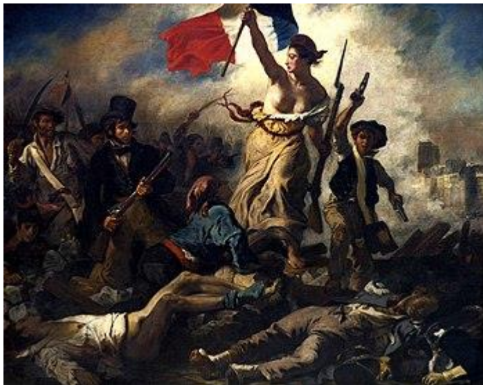
İLL 5.Ejen Delakrua “Azadlıq barikadası”