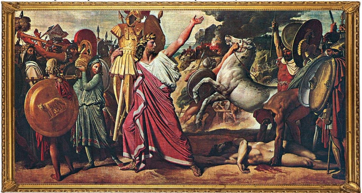
İLL 4.Dominik Enqr “Romul-Akronun qalibi”

“Jan Öqüst Dominik Enqr:xətt incəsənəti” mövzusunda fransız klassisizminin nümayəndələrindən biri tarixi və portret janrının görkəmli sənətkarı, rəssam Jan Ogüst Dominik Enqr yaradıcılığı təhlil edilir. Öz müəllimi David kimi, o da antik dövr və italyan İntibahının rəssamları ilə maraqlanır, Rafaeli əlçatmaz ideal hesab edirdi.Enqr öz yaradıcılığında canlı təbiətin qüsurlarından təmizlənmiş ideal, mükəmməl forma yaratmağa can atması, “ideal rəsm”i hər şeydən yüksək qiymətləndirməsi barəsində məlumat verilir. Rəssamın şagirdlərinə dediyi: “Xətt - rəsm deməkdir, bu isə hər şeydir!” ifadəsi dərslikdə tarixi janrdə təqdim edilən əsərlər üzərində təqdim edilmişdir.