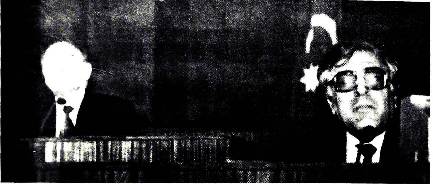
Milli Məclisin ilk iclası