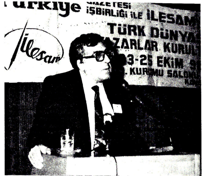
Istanbulda Qurultayda çıxışı