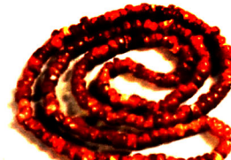
Tunc dövrünə aid nümunələr. Şənkir.