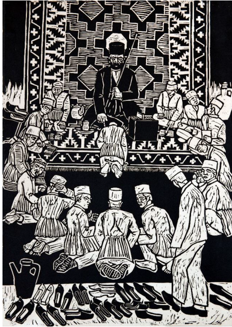
Ə.Rzaquliyev. “Mədrəsə” (“Köhnə məktəb”). “Köhnə Bakı” silsiləsindən. 1961.

“Mədrəsə” (“Köhnə məktəb”) (1961) və “Mədrəsədə cəza” (1962) əsərlərində molla tərəfindən dərslərini yaxşı oxumayan şagirdlərin cəzalanma səhnəsi canlandırılıb.