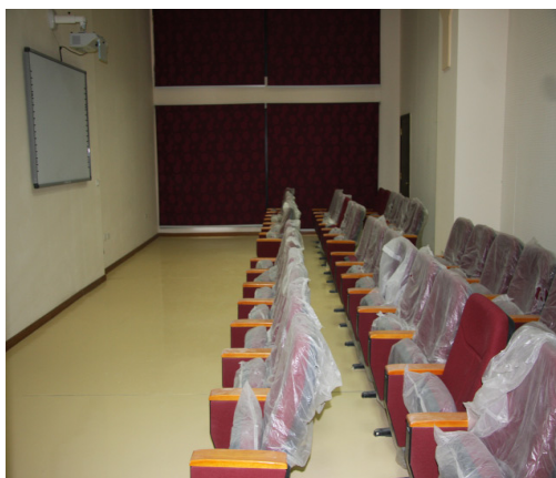
Oxucular üçün nəzərdə tutulmuş elektron müəllim zalı

Deyilənlərdən Milli Kitabxananın dövrün tələbləri ilə ayaqlaşması, irsini qoruması cəhdləri və dünyanın bütün nöqtələrindən buraya gələn tədqiqatçı və oxuculara ən yüksək xidmət göstərmə arzusu açıq-aydın görünür.