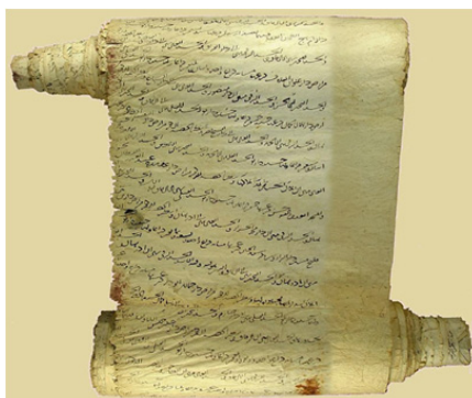
Kitabxananın kral və sultan hökmlərini daşıyan bir kolleksiyasından nümunə

Əlyazmalar və rəsm lövhələrini ehtiva edir, bağlı rəflər sistemi ilə hazırlanıb. Tədqiqatçılara əlyazmanın nömrəsini və mövzusunun əldə etməyə kömək edən kataloqlar vardır. O, tədqiqatçılara xidmət etmək və onlara istiqamət vermək üçün mikrofilmə yüklənmişdir. Hal-hazırda bu əlyazmaları İslam Anlayışları Cəmiyyəti ilə birgə əməkdaşlıqla yüksək keyfiyyətli fotoqrafiya ilə rəqəmsallaşdırmaq üçün iddialı bir layihə vardır.