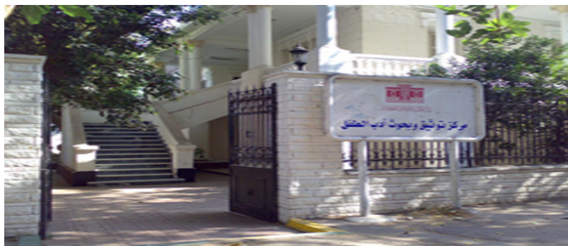
Uşaq Ədəbiyyatının Sənədləşdirilməsi və Tədqiqi Mərkəzi

Mərkəz öz ixtisası sahəsində bir neçə elmi əsər nəşr etdirmişdir. "Uşaq Ədəbiyyatı Araşdırmalar və Tədqiqatlar" adlı elmi jurnalının bir neçə nömrəsini çap etdirmişdir.