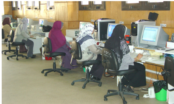
Skaner və elektronlaşdırma prosesi

Rəqəmləşdirilmiş nüsxələrin qıraəti üçün kitabxanada elektron müəliə zalı oxucuların istifadəsinə verilmişdir. Elektron müəliə zalı bütün Misir və əcnəbi tədqiqatçılarına xidmət etmək üçün ən yeni kompüter və müasir texnologiyalarla təchiz olunmuşdur.