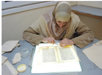
Kolleksiya-ların qorunması və bərpası işləri