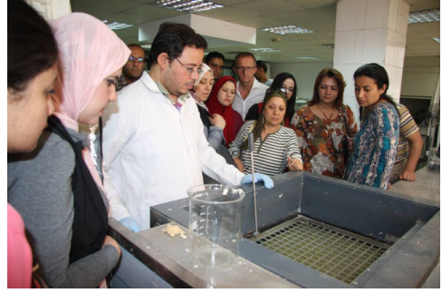
Restavrasiya və Kitabxanaçılığa dair təlim işləri