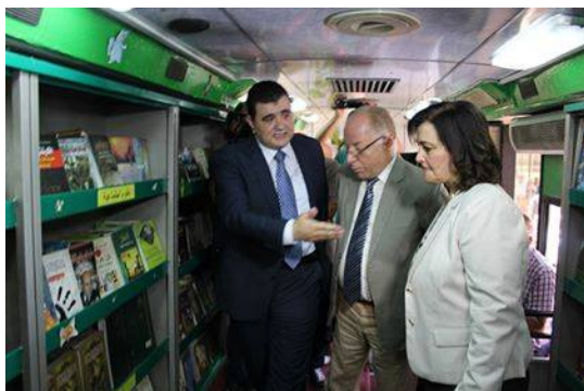
Səyyar kitabxana Ciza məntəqəsində yerləşən zooparkda