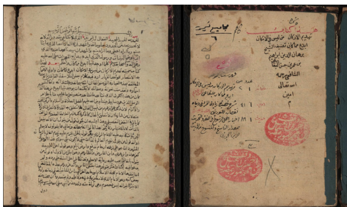
Misir Milli Kitabxanası kolleksiyasından bir əlyazma