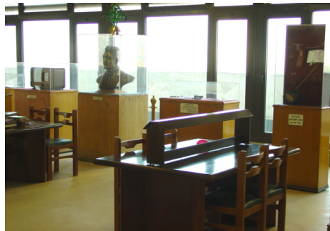
Xüsusi və bağışlanan kitablar kitabxanası zalı