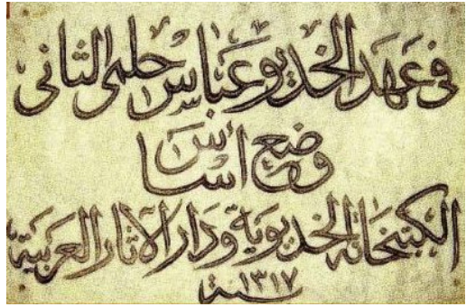
Bab əl-Xalq məntəqəsində Darul-Asar əl-Arabiyya və Xidivvi Kitabxanasının təməl daşının qoyulmasında təsis etmə lövhəsi