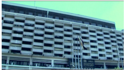
Nil sahilində Milli Kitabxana və Arxiv binası