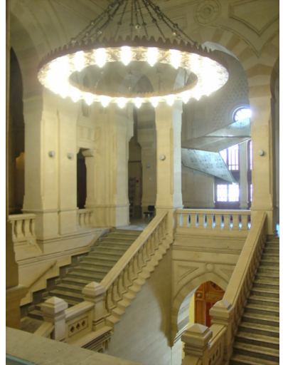
Bab əl-Xalqda yerləşən Milli Kitabxananın binası

Kitabxanada muzey eksponatlarının sərgisini təşkil etmək üçün xüsusi yerlər ayrılmışdır. Eksponatlar ən nadir və ən qiymətli irs toplusundan ibarətdir. Bu eksponatlar vasitəsilə Milli Kitabxana din, tibb, astronomiya, ədəbiyyat və dilçiliyə dair Ərəb, Türk və Fars dillərində yazılmış müxtəlif sahələri əhatə edən əlyazmalardan, xəttinin keyfiyyəti, dekorasiyasının zərifliyi, qravürlərinin gözəlliyi ilə xarakterizə olunan və qızıl suyu ilə örtülmüş Müqəddəs Quran kitablarının əlyazmalarından, Ərəb xəttatlığı papirusları və lövhələrdən, erkən mətbu əsərlər və nəşrlərdən, xəritələrdən, pul vahidləri, sikkələr, muzeyə gələnlərin ilk dəfə gördüyü muzey eksponatlarından ibarət Ərəb və İnsan mədəniyyətinin irs olaraq qoyduqlarını təqdim edir. Muzeyin sərgi zalları ən son texniki səviyyədə hazırlanmışdır.