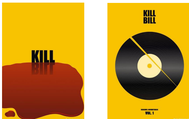
Рис. 1. Ряд плакатов Эльнура Бабаева в ретро стиле для фильма Квентина Тарантино "Убить Билла"

естественно, что последние оказывают влияние на тренды создаваемых объектов посредством графического дизайна. Например, сегодня одна из самых знаменитых концепций, объединившая передовой опыт в дизайне, общепринятые стандарты и внешнюю привлекательность является концепция Material Design, которую представил и внедрил Google. Разработчики Google более 2 лет предоставили свою концепцию дизайна пользовательского интерфейса приложений [4]. Графические дизайнеры применяют принципы приемов плоского дизайна и внедряют в своих разработках. Этот визуальный язык отличается преднамеренным выбором цвета, масштабной типографской и смелым использованием пустого пространства [4]. Плоский дизайн, особенно в сочетании с минимализмом — сильный эстетический инструмент в арсенале дизайнера [5].