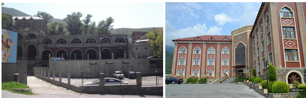
Рис.5. Строительство современного отеля «Шеки-палас» напротив Верхнего Караван-сарая в Шеки, Историко-Архитектурный заповедник «Юхары баш»

Шеки в 1990 г. был разработан проект заповедной зоны, предусматривающий зоны регулирования застройки, зоны охраны ландшафта и обзорного пространства [6]. В проекте выявлены опорная застройка древней части, основа древней планировки XVI в. и планировки конца XVIII в. Одним из важных разделов проекта является схема ограничения высоты новой застройки или линии высотных ограничений [6]. Особое внимание в проекте было уделено охране памятника международного значения Дворцу Шекинских ханов, расположенного в крепости на холме, в завершении центральной исторической магистрали. Были также оговорены предлагаемые границы охраны заповедника. Но, необходимо отметить, что проект не был реализован полностью, что и приводит к негативным для сохранения памятников и их исторической среды результатам. Так, несколько лет назад была предпринята попытка крупного строительства в непосредственной близости от дворца Шекинских ханов. К счастью, несмотря на заложенный уже фундамент, строительство данного объекта было остановлено. Зато несколько лет назад был построен новый многоэтажный отель в непосредственной близости от памятника архитектуры верхнего караван-сарая в Шеки (рис.5).