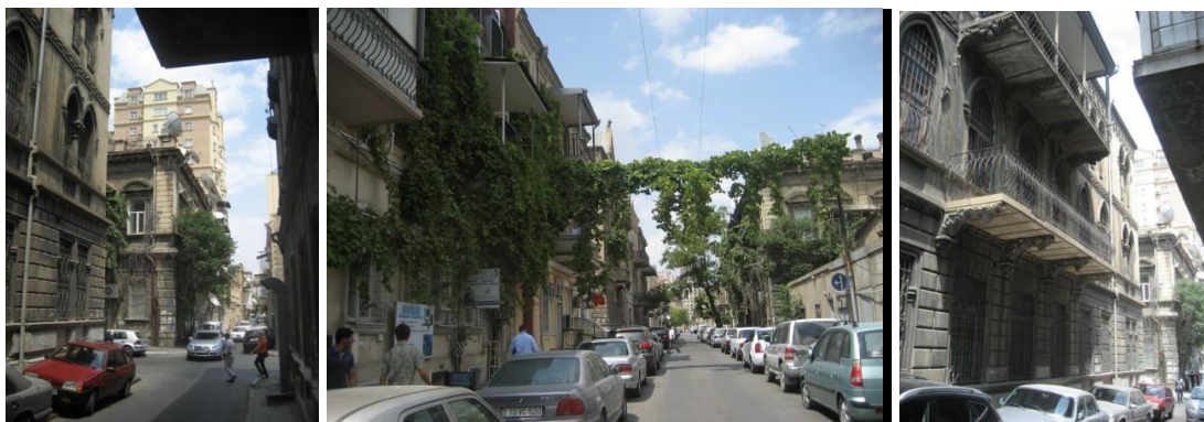
Рис.4. Загруженность исторических улиц Баку

Проблемы современного строительства в городах Азербайджана. Современный город- это не только новые здания, но и новые кварталы, новые магистрали. И, к сожалению, очень часто, пролегая в исторических кварталах, эти дороги, не только создают некомфортное качество жизни из-за большой концентрации углекислого газа, шума, пыли и т.д. Такая ситуация вредит сохранности памятников, поскольку вредные вещества оседают на зданиях, но и что также немаловажно, мешают восприятию здания. Теряется историческое окружение памятника, меняется его масштаб. Например, в условиях Баку, большинство архитектурных памятников, расположенных на исторических улицах города, просто незаметны в повседневной жизни. Узкие улочки не рассчитаны на современный поток машин, ситуацию также усугубляют постоянно припаркованные автомобили жильцов близлежащих домов и сотрудников расположенных здесь офисов и предприятий. В результате мы просто не видим красивейшие дома с великолепными деталями, традиционные для архитектуры XIX- начала XX века или выдающиеся своей неординарностью (рис.4).