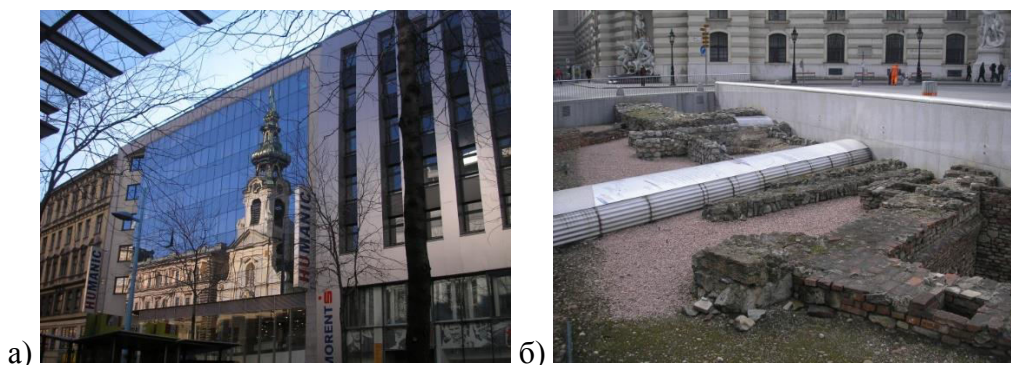
Рис.2. а- Отражение архитектурного памятника на стеклянном фасаде здания, расположенного на противоположной стороне дороги; б- Археологический памятник, превращенный в транспортную развязку

Другим интересным примером бережного отношения к исторической среде является сохранение случайно обнаруженного при прокладке дороги археологического памятника, который теперь используется как транспортная развязка- небольшой «пяточок», который не только регулирует транспортный поток, но и позволяет узнать исторические факты об обнаруженном объекте (рис. 2б).