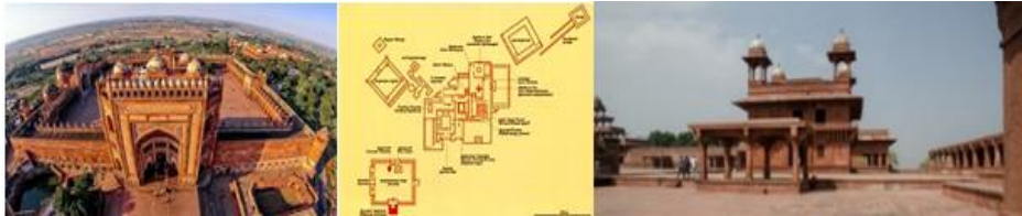
Şəkil 3. Hindistanın Futehpur Sihridə şəhəri Monqol imperatoru Əkbərin saray kompleksi, saray kompleksinin planı və saray divanxanası

İspaniyanın “Əlhəmra” saray ansamblından başqa Şirvanşahlar saray ansamblı ilə analoq Hindistan memarlıq incisi sayılan müsəlman memarlığı nümunəsi olan orta əsr hökəmdar sarayı Moğol imperatoru Əkbərin saray ansamblının memarlıq xüsusiyyətlərini araşdırmaq xüsusi maraq kəsb edir. 1569-cu ildən 1585-ci ilə qədər Hindistanın Futehpur Sihridə şəhəri paytaxt olmuş və bu şəhərdə imperator Əkbərin iqamətgahı sayılan gözəl bir möhtəşəm saray kompleksi tikilmişdir. Bu kompleks müasir dövrlərə qədər çox yaxşı vəziyyətdə qalmaqdadır [15], (şəkil 3). Əkbər Cəlaləddin Məhəmməd şah Babur şahlar imperiyasının davamçılarından olmuşdur. Hökəmdarın bu şəhəri tikdirməsinin səbəbi hörmətlə yanaşdığı və rəğbət göstərdiyi “ Ciştiiyə ” təriqətinin (sufi yönümlü islam təriqəti) yaradıcısı Səlim Çiştinin orada yaşaması idi.