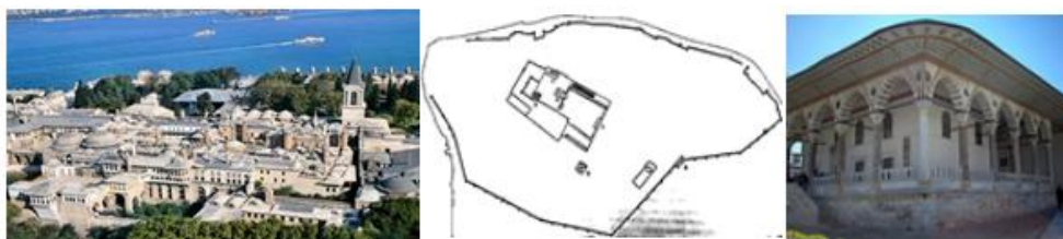
Şəkil 2. Sultan Fatih dövründə tikilən Topqapı sarayının ümumi görünüşü, planı və Arz otağının görünüşü

Bu kompleksin indiki “Topqapı” sarayından fərqli olaraq daha kiçik sahəyə malik olması və tikililərinə iki saray binası, arz otağı, hazire, qala divarı və əsas kompleksə daxil olan baş tağlardır (şəkil 2). Topqapı kompleksi ilk tikildikdə 700.000 m. 2 sahə, 3 həyət və göl- bağcadan ibarət idi [9]. Birinci həyətdə asimetrik plana malik olmaqla yanaşı, burada xüsusi günlərdə xalqın topladığı və dövlətə müraciət edə biləcəyi bir yer olaraq nəzərə tutulmuşdur. İkinci həyətdə sarayın xidmətləri üçün nəzərdə tutulmuş. Üçüncü həyətdə şahın sarayı, arz otağı və hazire (məscid və məzarlar olan yer) yerləşirdi [10]. 4 tərəfdən sütunlar sırası ilə vurğulanmış arz odası (divanxana) kompleksin ən qədim binalarından sayılır (şəkil 2.). Burada sultanın vəkilləri, əsgər komandirləri və səfirləri qəbul etmək üçün möhtəşəm bir divanxana tikilmişdir.