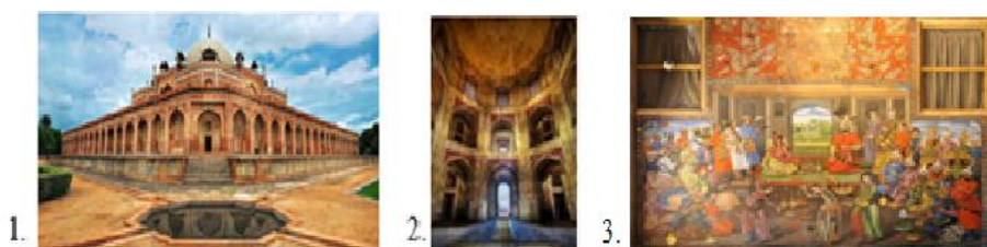
Şəkil 4. 1,2- Humayun məqbərəsinin ümumi görünüşləri və interyeri

Belə türbələrə misal, Humayun məqbərəsidir ki, onuntikintisi 1565-ci ildə başlanır və 1572-ci ildə tamamlanır (şəkil 4). 1993-cü ildən etibarən YUNESKO-nun siyahısına daxil edilmişdir [18].