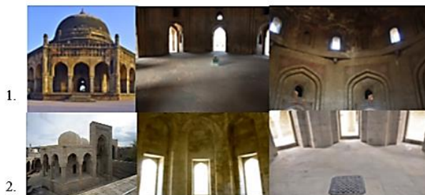
Şəkil 5. 1- Adham xanın türbəsi və interyerinin fraqmentləri

Memar Mirək Mirzə Qiyasın ucaltdığı Humayun məqbərəsinin prototipi kimi əsasən Tac Mahal məqbərəsi sayılır [19]. Tac Mahal tikdirən Cahan şah Humayun şahın nəticəsi olmuş, yuxarıda qeyd olunan Əkbər şah isə Humayun şahın oğlu olmuşdur. Bütün bu memarlıq abidələrinin bir-birinə oxşaması ilk tikilən tikili olan Humayun məqbərəsinin memarının Azərbaycanlı olması və çox maraqlı bir tarixçəsinin də mövcud olması ilə izah edilə bilər. Ümumiyyətlə Hindistan Moğol memarlığını dahada dərinlən araşdırdıqda, onun bir çox abidələrinin Şirvanşahlar kompleksinə aid tikililəri ilə bənzərliyinin şahidi oluruq. Belə tikililərdən biridə hökəmdar Əkbərin 1562-ci ildə hərbi sərkərdəsi olan Adhan xan üçün tikilən məqbərənin memarlıq formasıda ola bilər [20] (şəkil 6). Bu türbə Hindistanda Adhan xanın (Adhan xan Əkbər şahın süd qardaşı olmuşdur) və onun anasının xatirəsinə tikilmiş və bu sülalənin dini tarixini araşdırdıqda onlarda sufi təriqətindən olmaları da aşkar olunur. Bu məqbərənin üslub fərqliliyinə baxmayaraq ümumi plan strukturunun Azərbaycan divanxanaları ilə oxşarlığı və burada əsasən simvolik olaraq sufizmin təsiri altında olması da şübhəsizdir (şəkil 5).