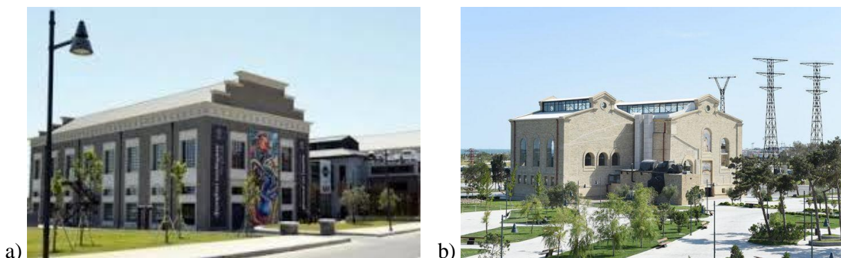
Şəkil 3. a) XX– XXI əsr Azərbaycan rəngkarlığı muzeyi, b) Daş salnaməsi muzeyi

Sənaye binalarının funksiyalarının dəyişdirilməsinin digər nümunələri kimi XX– XXI əsr Azərbaycan rəngkarlığı muzeyi (Paris kommunası adına keçmiş gəmi təmiri zavodu), daş salnaməsi muzeyi (Krasin adına keçmiş DRES) və müasir incəsənət mərkəzi YARAT (Xəzər dənizi flotiliyasının hərbi gəmiləri üçün keçmiş anbar) xidmət edə bilirlər (şəkil 3).