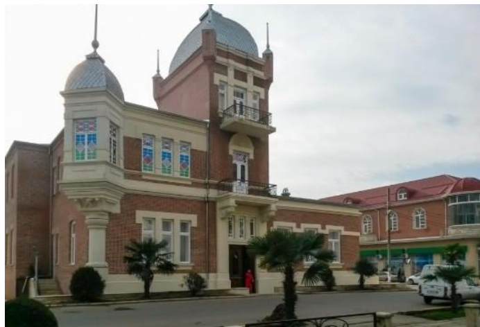
Şəkil 1. Lənkəranda Xan evi

Muzeyləşdirmənin miqyası bizim günlərimizdə də çox əhəmiyyətlidir. Bir çox saraylar muzey siyahısını tamamlayır (Şirvanşahlar sarayı, Şəki xan sarayı, Lənkəranda Xan evi və s.), “qorunub saxlanmış tarixi interyerləri olan saraylar ekskurs baxışlar üçün dayanıqlı tendensiya olmuşdur” (şəkil 1).