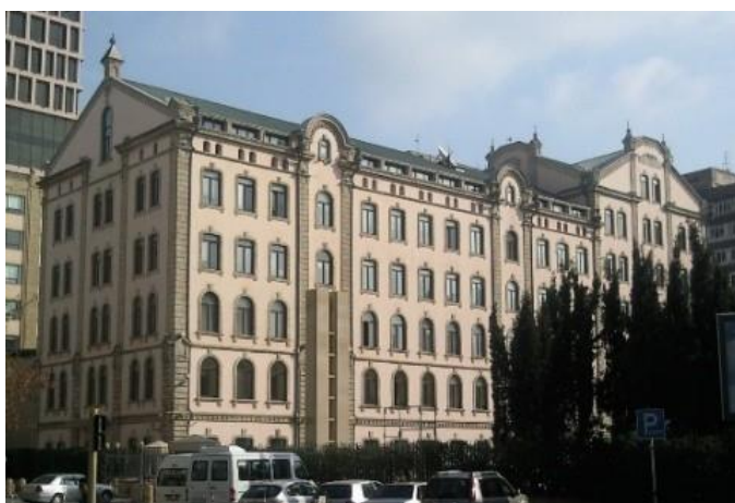
Şəkil 2. Bakıda “Landmark” ofis-mərkəzi

ölkələrində onları turizm, ticarət məqsədilə kafe və restoranlar, ofis və iş mərkəzləri, mehmanxana və çoxfunksiyalı mərkəzlər kimi istifadə edirlər. Bu sxem üzrə şəhərlərin hal- hazırda ən gözəl yerlərində yerləşmiş bir sıra tarixi sənaye, liman və anbar obyektləri ticari istifadə üçün cəlbedici status əldə edərək yeni həyata nail oldu. Əvvəllər həbsxana kimi istifadə olunmuş Londondakı Courthouse Hotel Kempinski, Lyusernadakı Lowengraben və Stokholmun tam mərkəzində Langholmen binalarında açılmış beş ulduzlu otellər daha gözlənilməz nümunələrdi. Belə obyektlər– XIX əsrin ikinci yarısının sənaye memarlığının (fabrik- zavod) nümunələri Rusiyada da az deyil. Bu dövrdə çoxlu sayda spesifik qurğular tikilmişdi: depo, keşikçi evləri, kazarmalar, anbarlar, su qülləsi. “Bu gün dəyişilmiş texnologiyalara görə bu tikililərin çoxu öz ilkin təyinatına görə istifadə olunmur və onlar ya boş qalıb dağılırlar ya da savadsız yenidənqurmalarla korlanaraq öz təyinatına görə istifadə olunmurlar”. Bakıda Nizami küçəsindəki XX əsrin əvvəllərində tikilmiş diyircəkli un üyüdən köhnə dəyirmanın yenidən qurulması Azərbaycandakı sənaye binalarının yenidən işlənilməsi nümunələrindən biri ola bilər. Yenidən qurmadan sonra burada “Landmark” ofis- mərkəzi yerləşdirilmişdir (şəkil 2).