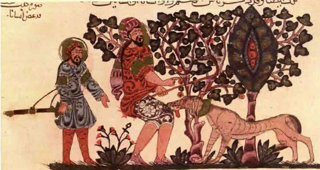
Artıq bu miniyatürlərdən sonra İran və başqa ölkələrdə portret miniyatürü meydana çıxır .

XI-XII əsrin Suriya və İraq rəngkarlığına aid bədii əsərlər az məlum idi. Lakin XIII əsrin I yarısına aid olan Bağdad və Ərəb Mesopotamiya məktəbinin ustaları, kitab illüstrasiyaları, minyatür əsərləri böyük maraq yaradırdı. Buraya o vaxtların məşhur Məkami Əl-Xəririnin kitabını bəzəyən miniyaturları aid etmək olar. Dioskoridin Farmakologiya adlı əlyazmasını bəzəyən 1922-ci il Abdullah İbn Fədl rəssamın illüstrasiyaları da məhz bu qəbildəndir. Ərəb miniyaturlarında biz lirik mənzərələri, nəfis rəng uyğunluqlarını, zəngin naxışlı kompozisiyaları və s təsvirləridə görmək olar.