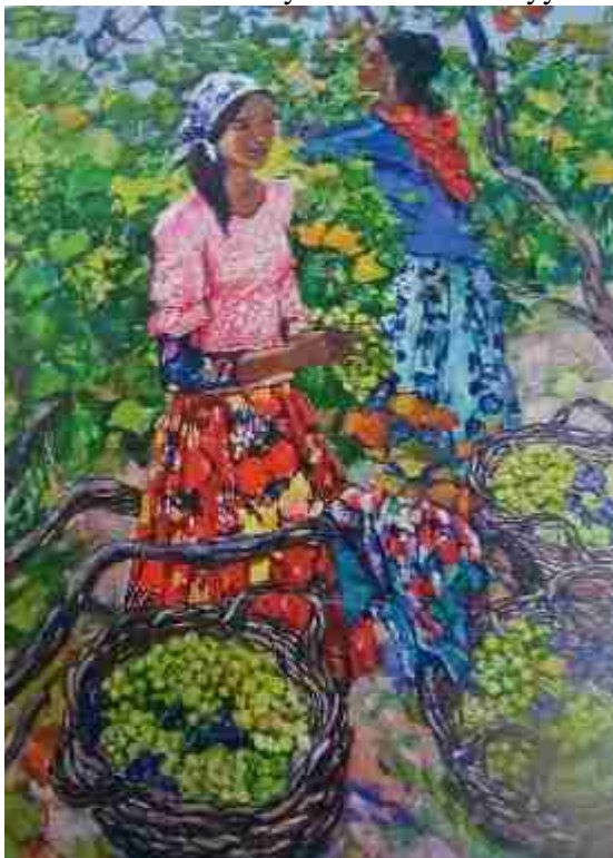
2.”Günəşli diyar (kətan, yağlı boya)

Xalidə Səfərova öz mənzərələrində payız fəslinin təsvirinə geniş yer ayırmışdı. “Parkda payız” əsərində sulu boya ilə qızılı rəngin və sarımtıl işıq bir-birinə ahəngindən istifadə edilmişdi. “Payız” əsərində isə bu fəslin ən sevimli meyvələrini yığan xanımlar təsvir olunmuşdu. Ön planda meyvələrin təsviri diqqəti məhz bu hissəyə cəlb edir. Məkan həlli, işıq və kölgənin, soyuq və isti rənglərin sintezi fəsil haqqında tamaşaçının gözü qarşısında canlandırılan bir mənzərə yaratmışdı. “Qızıl payız” (1987) və “Üzüm yığımı” (1987) hər iki mənzərədə xanımların geyimlərindəki əlvanlığı, koloritliliyi, dinamikanı və xüsusilə də rəssamın öz texnikasını aydın duya bilərik. “Günəşli diyar” (Şəkil2) və “Ceyranlar”- bu əsərlərdə simvolik olaraq qaranquşun və ceyranın təsviri mənzərədə yaz fəslinin xüsusiyyətləri kimi qeyd edilməlidir.