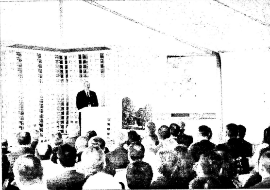
(əvvəlki səh. 3-də)

Azərbaycanda həm demokratik, həm də sosial-iqtisadi inkişaf paralel gedir. Buna görə hesab edərik ki, bizim cəmiyyətimizdə islahatlar təkamül yolu ilə aparılır və dərəcəsi. Siyasi və iqtisadi islahatlar daha da dərinləşməlidir. Söz azadlığı Azərbaycanı tam təmin edilə bilər, heç bir məhdudiyyət yoxdur. Məna verilən son məlumatlara görə, Azərbaycan əhəlinin taxminən 80 faizli internet istifadəçisi. Belə olan halda söz azadlığı ilə bağlı heç bir problem ola bilməz. Düzüldür, bezi hallarda bizi bezi qeyri-hökumət təşkilatları tənqid edir, hətta iftihar edirlər. Amma bu iftiharların heç bir əsası yoxdur. Bu, sadəcə olaraq qarazlı mövqeydir. Bunun səbəbi də bellidir. Amma real vəziyyətdə baxdıqda biz hamımız görürük ki, Azərbaycanı söz azadlığı və bütün başqa azadlıqlar tam təmin olunur. Sərbəst toplaşma azadlığı, siyasi fəaliyyət azadlığı, vicdan azadlığı, söz azadlığı, mətbuat azadlığı Azərbaycanı cəmiyyətinə təmin olunur və təmin olunaçaqdır.