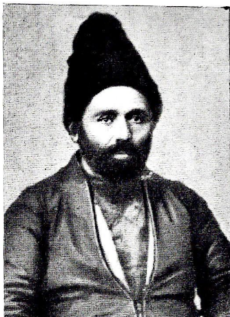
Мәшһури маһанды Һачы Һүсү. Мәгрүфу заманды Мәшәди Иси.