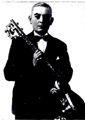
Муса Шушински илә бир чох илләр сәһнәт дәстләгу етмиш мәшһур тарзән Саша Тарханов (1928).

Көркәмли ханәндә Муса Шушински 1971-чи ил јанвар ајынын 25-дә Көнчә шәһәриндә вәфат етмишдир.