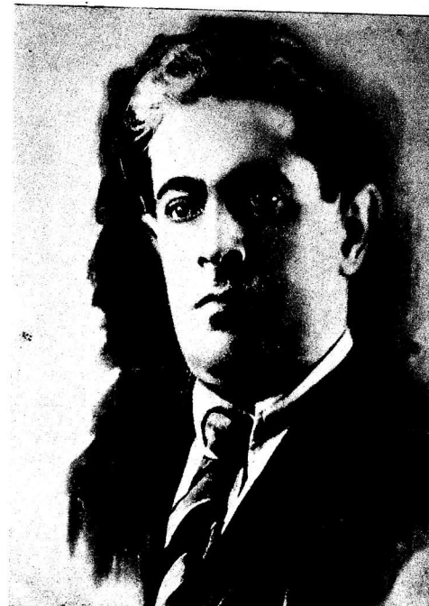
Хан Шушински (Бақы 1939-чу ил).

Шүбһәсиз ки, ханәндәләрин сәс кејфијјәти ејни, јәни стандарт олмур. Һәр ханәндә өз сәсинин тембринә көрә фәргләннр. Тәсадуфи дејилдир ки, халг арасында «көзәл сәс», «мәләһәтли сәс», «јағлы сәс», «зил сәс», «чыр сәс», «ачы сәс», «гуру сәс», вә јахуд «дузсуз сәс» ифадәләрини тез-тез ешитмәк олур. Ејни заманда мусиги елмини дәриндән биләиләр, ханәндәлик сәнәтиндән баш чыхаранлар бәднин көзәллији олмајан јекрәнк «дузсуз» сәси «ачы сәс», ајдын тембри олмајан сәси исә «гара сәс» адландырырлар. Ишләнмәмиш сәсә исә «хам сәс» дејилир. Лакин аһәнкдар сәси «јағлы сәс» адландырырлар. Хүсуси јумшагылыгы вә тембр көзәллији илә фәргләнән, динләјичини мәфтун едән сәсә исә «мәләһәтли сәс» дејилир вә јүксәк гијмәтләндирилир.