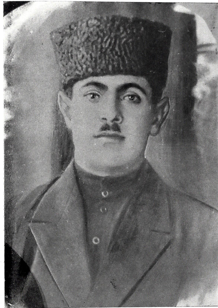
Хан Шушински (Тифлис 1934-чү ил)

Хан Шушински зəнкин вэ чохчəһəтли јарадычылыға малик бир ханəндэ иди. Онун охудуғу муғамлар тəкчэ Азəрбајчанда дејил, бütүн Јахын Шəргдэ мəшһурдур. Ханəндэлəримиз арасында Хан Шушински кəркəмли јер тутур. Ону башга ханəндэлəрдэн фəрглəндирэн чəһəтлэр-