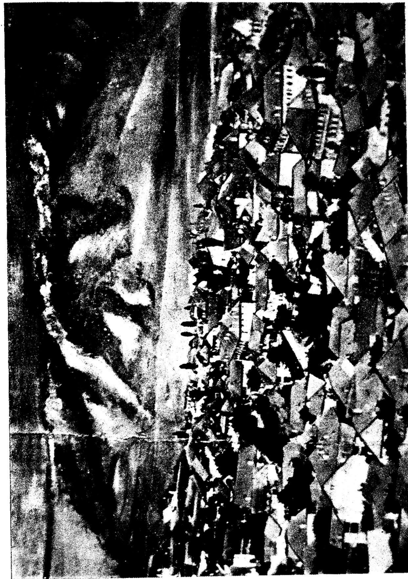
Шуша. XX сәрин әввәлләри.

1918-чи илин пайыз фәсли иди. Гарабағын бағлы-бағатлы кәндләриндән бири олан Новрузлуда күллү-чичәкли бир һәјәтдә көзәл мәчлис гурулмушду. Мәләһәтли сәси, кәдәрли күшә вә халлары илә «Секан» муғамыны инчә бир зөвг илә ифа едән мөшһур мүғәнни Ислам Абдулла-